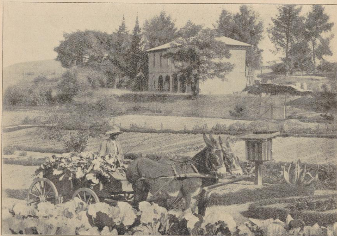
Im Garten von Mariannhill.

Eines Tages sah ich vom Fenster unseres kleinen Zimmers aus, wie in der freien Zeit eine Kindergruppe in eifrigem Gespräche beieinander stand und sinnenden Auges zu einem Bildstöckchen ausblickte, in dem sich ein treues Abbild unserer lieben Frau von Kirchtal befindet. Sie standen eine Weile mit gefalteten Händen davor und sahen sich dann um, wie um sich zu versichern, ob das Feld auch rein sei, und sie es wagen dürften, ihren Plan auszuführen. Als sie niemand sahen, ver-