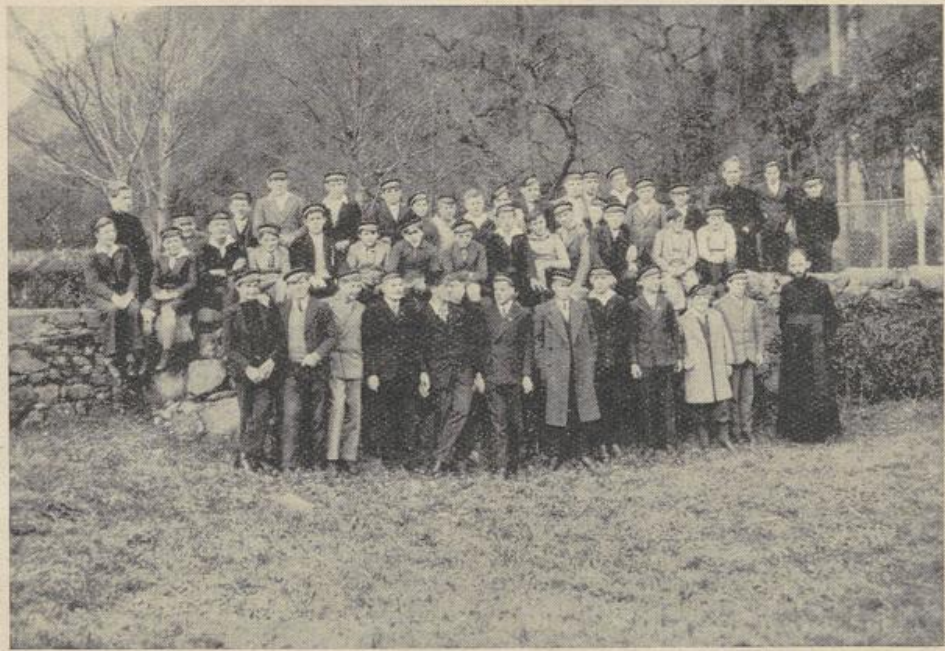
Zum Spaziergang bereit! Mariannhiller Missionsstudenten in Altdorf, Schweiz