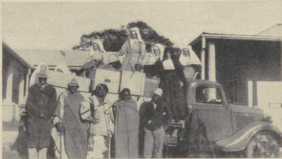
Ankunft in Ewele der im Juni dieses Jahres aus St. Ursula, Brig, abgereisten Missionarinnen