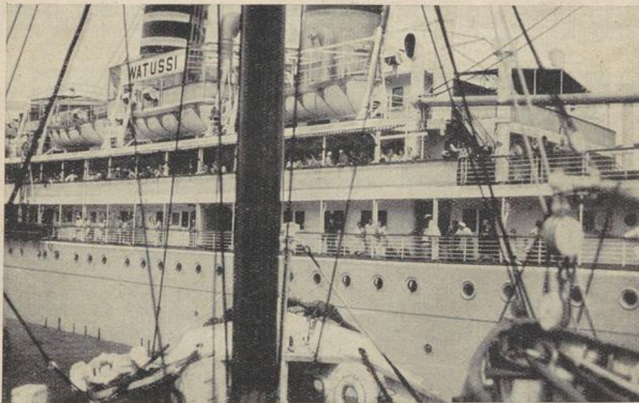
Lotfenboot und deutscher Dampfer „Watuissi“ im Hafen von Durban, dem Landungsplatz unserer Afrika-Missionare

An Hospitälern in Jerusalem mögen erwähnt werden, das französische, italienische, deutsche und englische, sodann die englische Augenklinik. Auch in anderen Orten Palästinas gibt es Hospitäler, wovon die meisten den