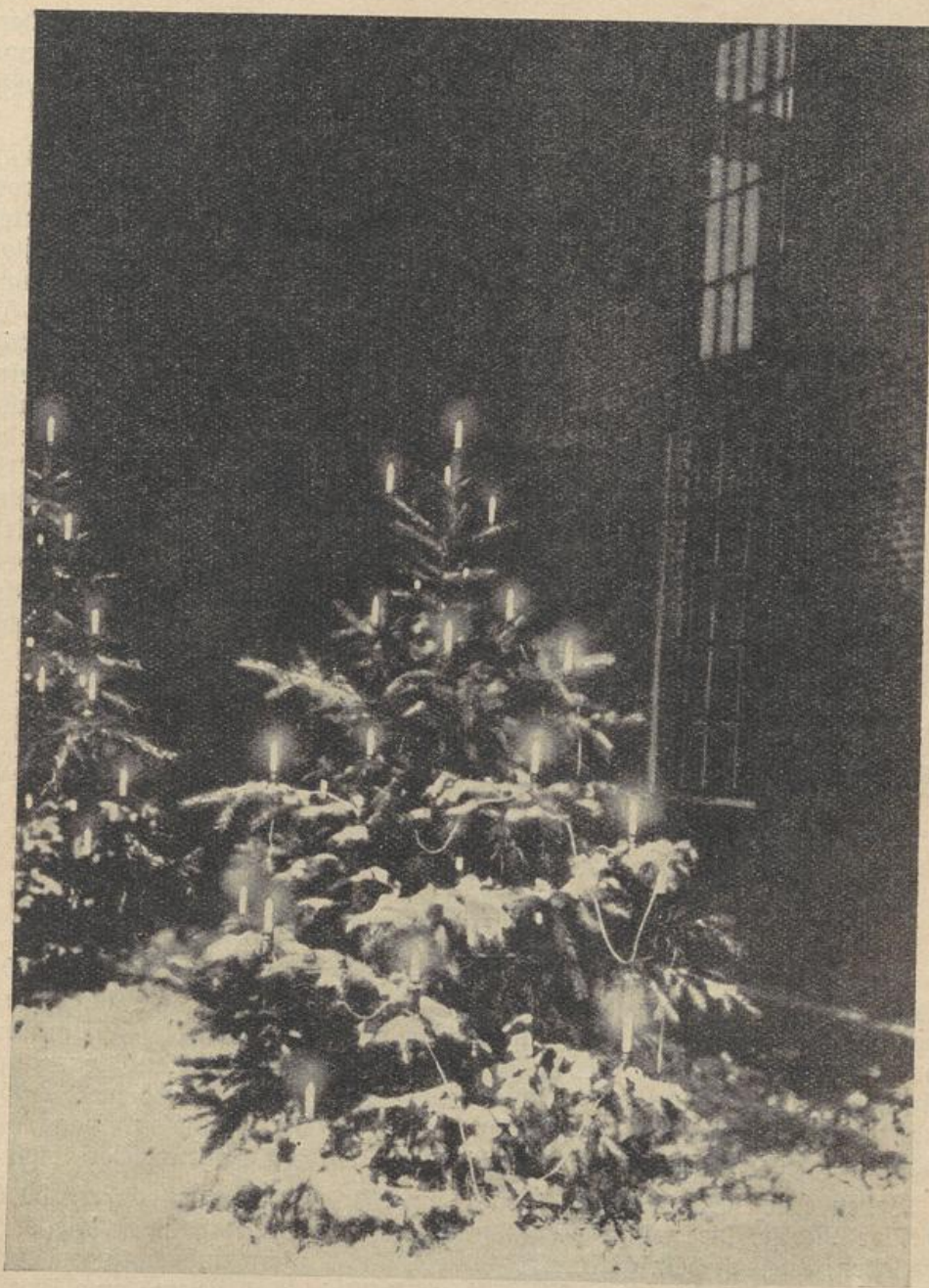
Stimmungsvoll wirkt dieses weihnachtliche Leuchten selbst in dem sonst so nüchternen Fabrikhof