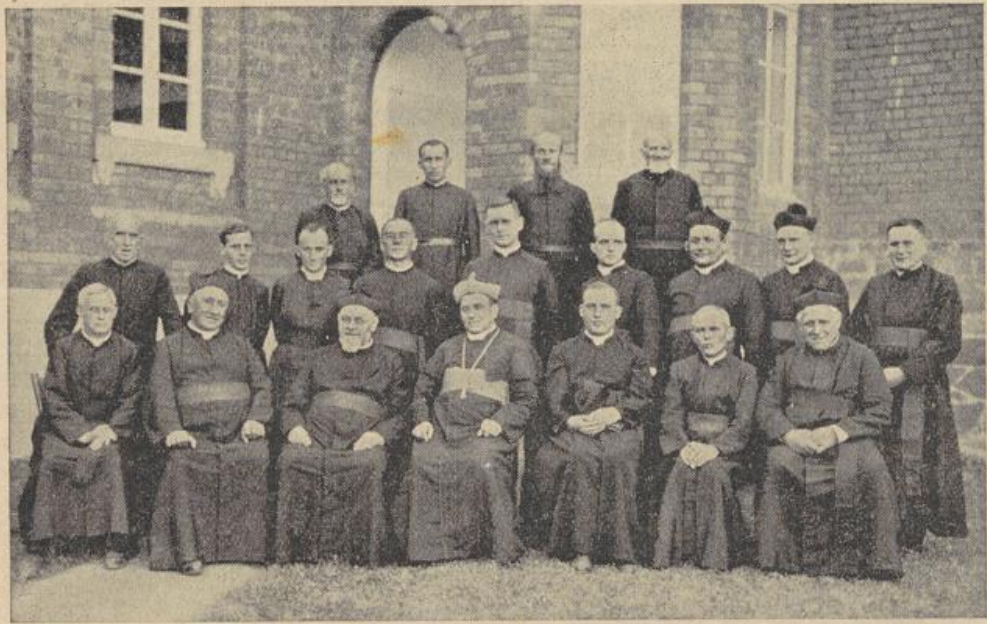
Der neue Bischof von Umtata inmitten seiner Missionare

Freude an dem großen Ereignis fand auch noch in mehreren außerkirchlichen Feiern zu Ehren des neugeweihten Bischofs ihren Ausdruck.