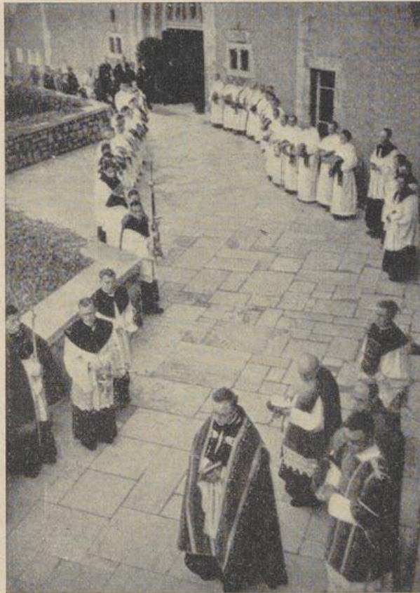
Mariannhiller Weibekandidaten erwarten vor ihrer Seminarikirche den Bischof

Ein andermal besuchte uns ein englischer Schulinspektor. Es waren mehrere englisch sprechende Patres zugegen. Man plauderte englisch. Der Schulinspektor war ein richtiger Gentleman, vornehm und höflich. Nach dem Mahle fragte er: „Kann die Sr. Oberin englisch?“ Wir meinten: „Sie ist nicht gewohnt, englisch zu sprechen.“ „Gut“, sagte er, „ich werde mich bei ihr auf deutsch bedanken.“ Nach einiger Zeit kam die Sr. Oberin herein. Der Engländer erhob sich, reichte ihr freundlich die Hand