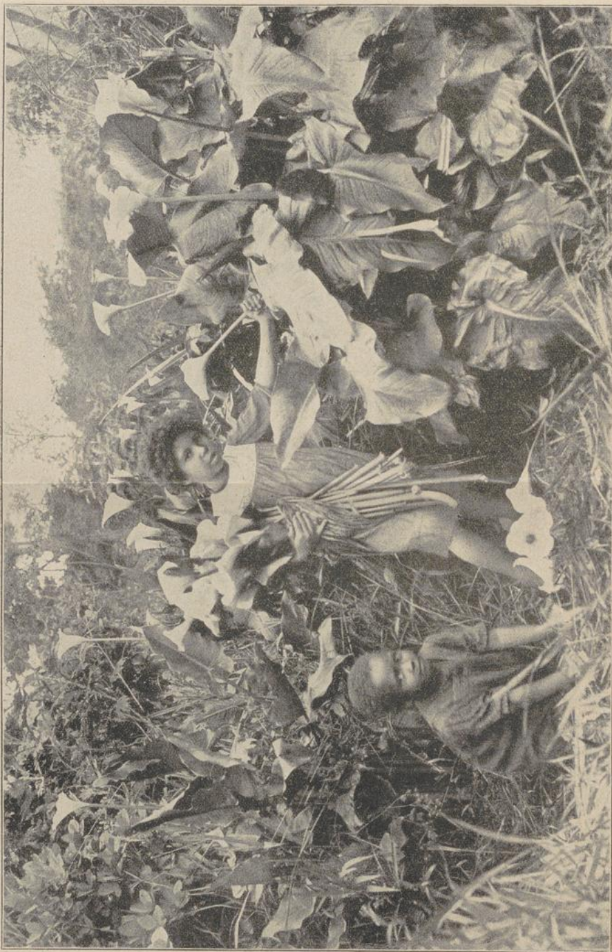
Zwischen Ellen. (Vegetationsbild aus Südafrika.)

Der Drang nach Freiheit und Ungebundenheit wurde in ihnen schon durch das ewige Wandern und Umherschweifen genährt. Sie hatten keine festen Wohnsitze, sondern schlugen ihr primitives Lager da auf, wo sie ge-