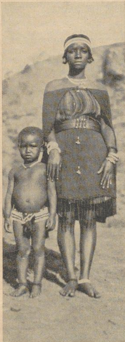
Heidnische Mutter mit Kind

Kindern aber spielten sie nicht Vater und Mutter, sondern Mann und Frau. (Sehr bezeichnend für die Denkweise des Eingeborenen, der Materialist ist.) Das eine Mädchen fungierte als Frau und war gerade daran an der Hütte zu bauen. Der Mann mußte anfangs helfen Baumaterial herbeischaffen; dann war es für ihn schließlich Zeit zur Arbeit zu gehen um etwas zu verdienen. Der Tag wurde als Zahltag gerechnet. Nun kam der Mann wieder zurück mit dem Geld (kleine Steinchen). „Was hast du mir alles gekauft? Ein Kleid, Schwaren usw.“ „Hier ist dein Kleid und da hast du Geld.“ „Ist das alles?“ „Nun, ich muß doch auch in die Kantine gehen zum Bier.“ Nun ging ein gut nachgemachtes Gezeter los und schließlich machten die Buben dem Spiel der Mädchen ein Ende, wie es nun einmal die rohe Art der Buben ist. O kindliches Spiel, du sagst uns so viel, ja nur zu viel. Wie viel Sünde schreit wohl jede Nacht empor zum Himmel von diesem Fleckchen Erde, auch Location genannt, das Eingeborenenviertel Bula-waho.