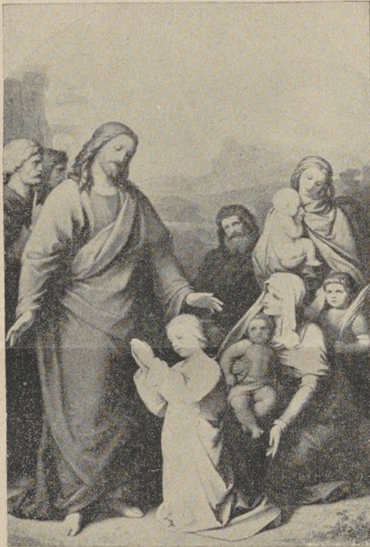
„Laßt die Kleinen zu mir kommen!“

Es verstrichen Monate, da kam endlich von Sageni ein schwer leserlicher Brief, den Komjiba nur mit vieler