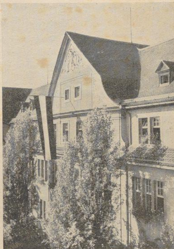
Missionsseminar Alohsianum, Lohr a. Main

P. Direktor, Missionsseminar Alohsianum, Lohr a. Main, Unterfranken.