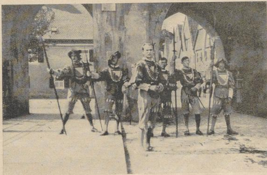
Reimlinger Missionsstudenten besetzten die Stadttore von Nördlingen bei der Erinnerungsfeier der Schlacht bei Nördlingen (1634)

rungsmitteln. So hatte eine Gruppe Mädchen kleine hohle Kürbisse mit Steinchen gefüllt an die Füße gebunden. In den Händen schwingen sie an Stöcke befestigte Konservendosen, welche ebenfalls mit Steinchen gefüllt waren. Sie tanzten und hüpfen und vollführten einen Lärm, als schleife man Ketten über ein Blechdach. Doch haben sie mit ihrer Erfindung eine gewaltige Sensation gemacht und werden bald viele Nachahmer finden. Auch die Weiber tanzen mit, ihnen sind scheinbar ihre kleinen Kinder, die sie auf den Rücken gebunden tragen, gar kein Hindernis. Man meint unwillkürlich, die Kleinen müßten bei dem Hüpfen und Stampfen ihrer Mütter die Seekrankheit bekommen. Ach woher! Die kleinen Kerle sind quitsch-fidel dabei und quittieren jeden Luftsprung ihrer Mamma mit lautem Gefrähe. Sogar die Kinder werden von der allgemeinen Tanzwut angesteckt, die vom Zuschauen allein nicht befriedigt