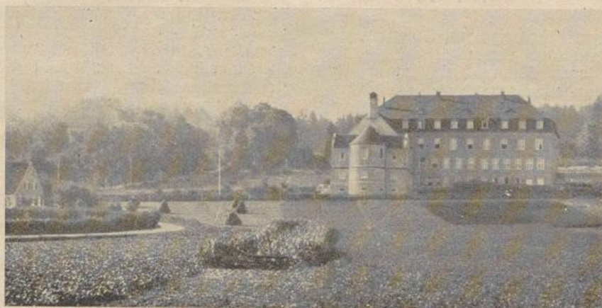
Missionsseminar St. Joseph Reimlingen, bähr. Schwaben