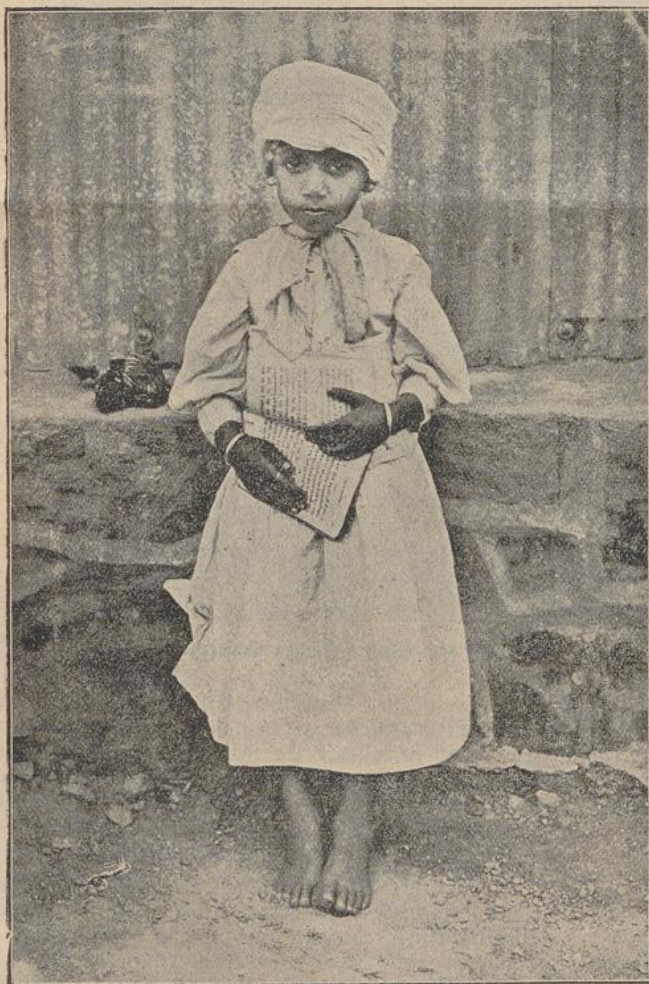
Sohn des Maharadsch (Brahmane), der lezteingereichte Schüler in unserer Hinduschule zu Rooi-Kopjes.

Trotz alledem fielen wiederholt räuberische Stämme ein und zwangen dadurch die Eingebornen, in ihrem berg- und schluchtenreichen Lande für sich und ihre Herden starke, fast uneinnehmbare Festungen anzulegen. Gewöhnlich wählten sie dazu hohe, steile Berggipfel, die an sich schon von einer Menge gewaltiger Steinblöcke umgeben waren und daher leicht verteidigt und noch mehr be-