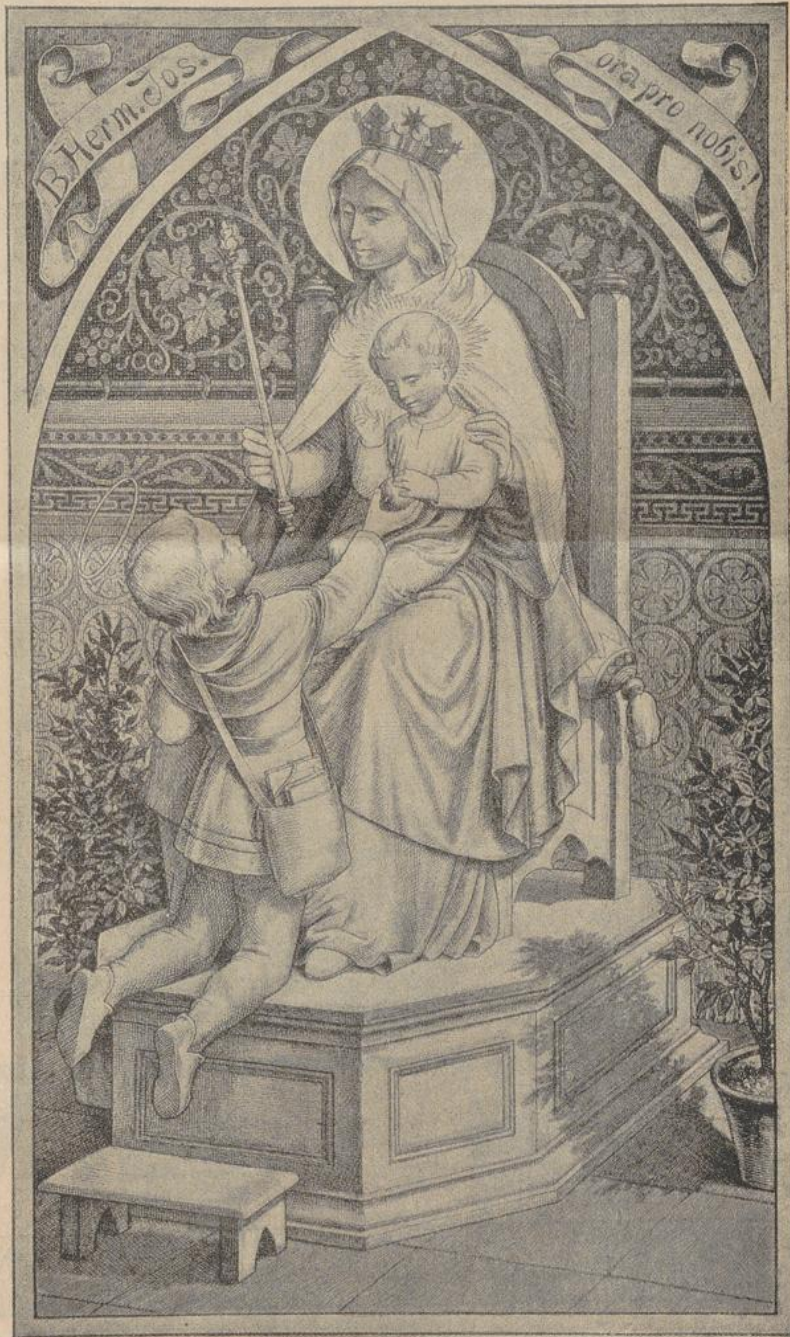
Der sel. Hermann Joseph.