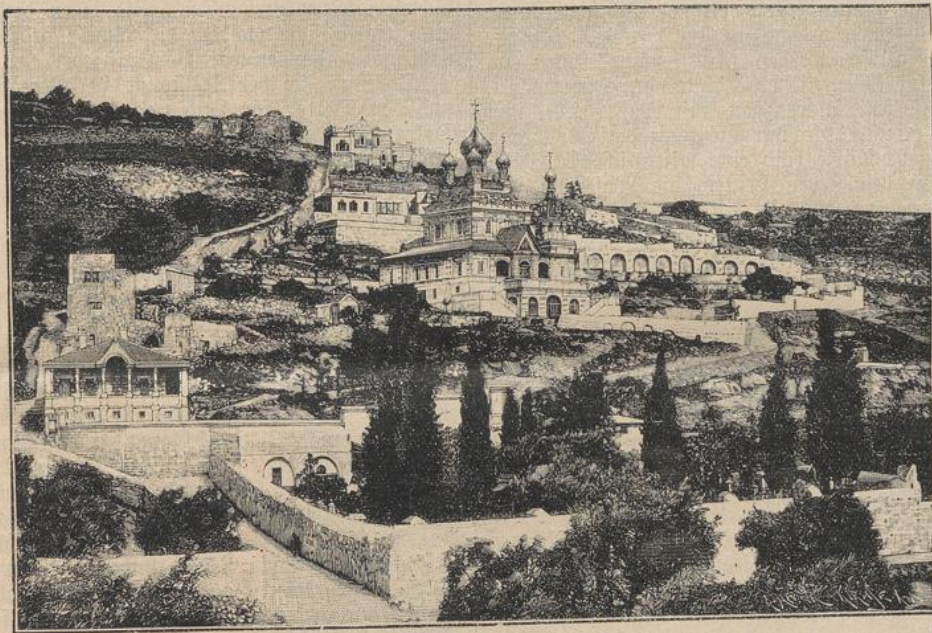
Der Garten von Gethsemane.

protestantischen Viertel ein junger, gut gekleideter Mann hieher gekommen mit der Bitte, ich möchte mit ihm gehen und einen Schulknaben taufen, der schwer krank zu Hause liege und gar sehr nach einem katholischen Priester verlange. Die Taufe durch einen wesleyanischen Prediger weise er zurück, er wolle nur von uns getauft werden. Da gab es keinen Aufschub; ich jattelte sofort mein Pferd und machte mich mit meinem schwarzen Begleiter, der zu Fuß ging, auf den Weg. Doch welch ein Weg! Da lag einfach bodenloser Kot auf der tiefdurchweichten Straße, denn von allen Hügeln und Bergen strömte das Wasser der Straße zu und sammelte sich hier wie in einem Flußbett. Dabei regnete es ohne Ende. Es froh mich ordentlich auf meinem Gaul, und das Wasser lief mir aus dem Regenmantel in die Schuhe hinein, was dem Katarh, an dem ich seit mehreren