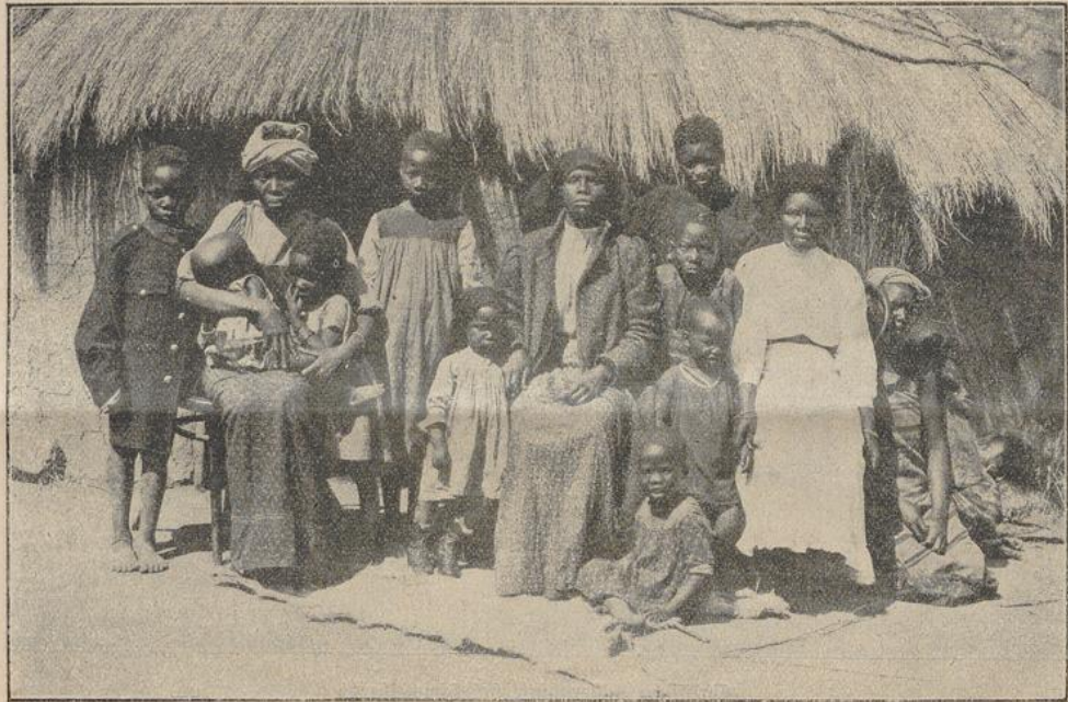
Christliche Basuto-Familie in Intomazana, eine Katecheseinstelle von Reichenau.