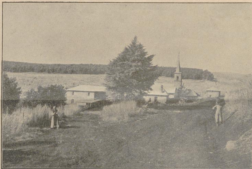
„St. Fidor“, eine Filiale unserer Missionsstation Mariatal.

Bergnügt trabte ich der Heimat zu und bat meine Brüder und Freunde, mir das Tier holen zu helfen. Sie gingen sofort mit, doch wir alle zusammen hatten mit dem stözigen, eigenwilligen Tier ein hartes Stück Arbeit. Wir mußten es frei treiben, denn am Stricke führen ließ es sich absolut nicht. Es blieb auch auf keinem Weg, sondern brach beständig, bald nach dieser, bald nach jener Richtung hin, aus. Jeden, der sich ihm nahte, drohte es auf die Hörner zu nehmen und zu durchbohren; kurz, es war eine Heze auf Leben und Tod. Manchmal schien es müde zu sein, doch nur zum Schein; kurz darauf gebärdete es sich wilder als zuvor und rannte abermals davon.