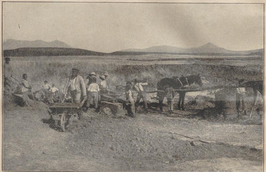
Siègefabrikation in Lourdes.