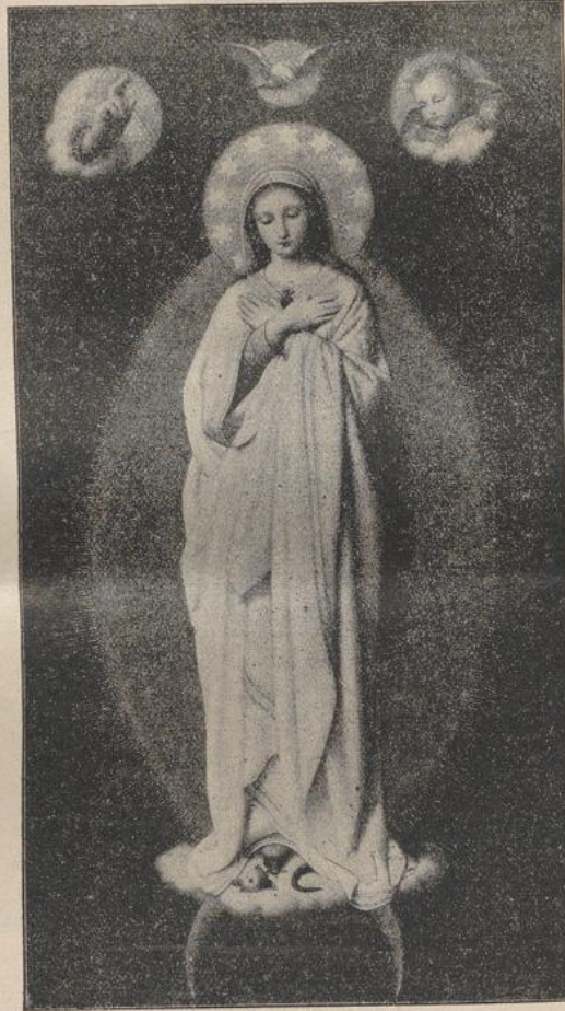
Unbefleete Empfängnis. (B. Röhlen, M.-Glabbach.)

„Mein Sohn stand schon über ein Jahr an der Front und hatte schwere Kämpfe mitgemacht. Ich empfahl ihn dem Schutze der hl. Familie, sowie den 14 hl. Nothelfern und versprach ein Heidenkind auf den Namen M. Joseph taufen zu lassen. In der Folge wurde mein Sohn bei einem furchtbaren Sturmangriff leicht verwundet, kam zurück und wurde nach einem Jahre aus dem Kriegsdienste entlassen. Ich hatte auch die armen