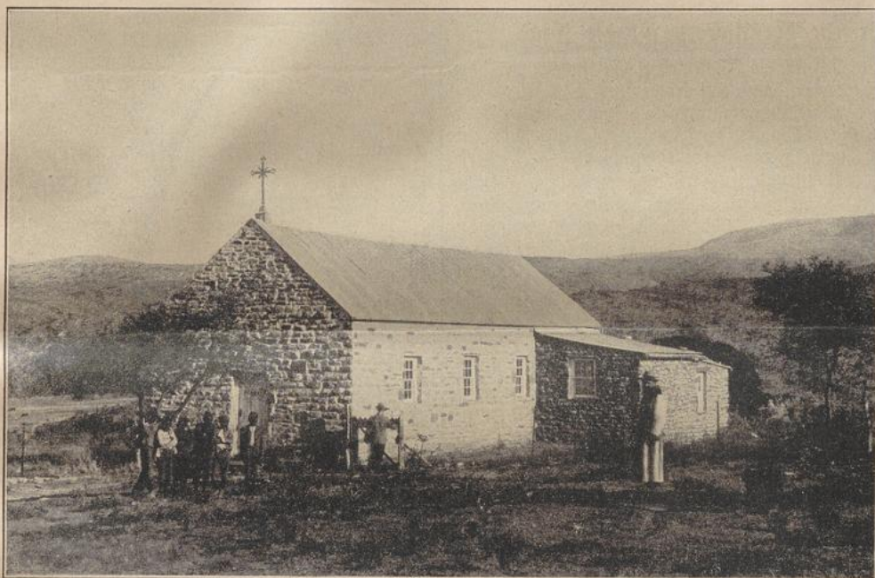
Außenstation Sigudu bei Keilands.

Auf der Reise trägt der Regus eine Krone auf dem Haupte und ist unverhleiirt; immerhin bleibt seine Person durch lange rote Vorhänge verhüllt, die auf hohen Stangen getragen werden und in deren Mitte er auf einem reichverzierten Maulejel reitet. Innerhalb dieser Vorhänge sind ferner die sechs Stallmeister, Legameneos genannt, von denen zwei den Maulejel am Bügel führen,