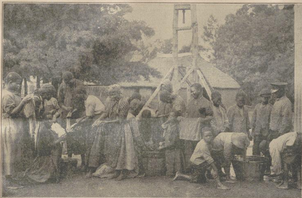
Große Wäsche. (Missionsstation Mariabilf.)

Bei der letzten Audienz hatte ich mich davon überzeugt, daß der Negus in der Theologie und heiligen Schrift vortrefflich bewandert war; in der Folge wurde ich in dieser Ansicht durch verschiedene Fragen, die er an