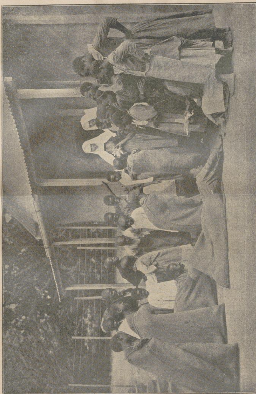
Wettbewerb im Sadlaufen. (Mädchenschule der Mariannehauer Missionsstation Lourdes.)

am Arm, andere bemühten sich um das erschrockene Kößlein. Alles, Mann und Roß und Wagen, war ohne Bruch und Schaden, und so bestieg ich nach kurzer Rast mein Wägelchen wieder und fuhr schön langsam und be-