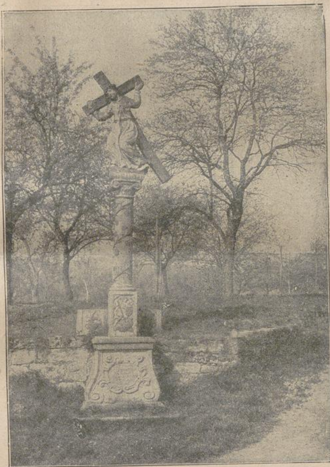
Bildstock vor dem blühenden Obstgarten. Gartenlaube 1917.

"Sonderbares Kind!" sagte die Frau; „ich begreife dich nicht. Deine Reden von deinem Glücke in deiner dunklen Torstube, und von dem Unglücke hier bei mir, kommen mir seltsam vor. Ist denn gar nichts in meiner