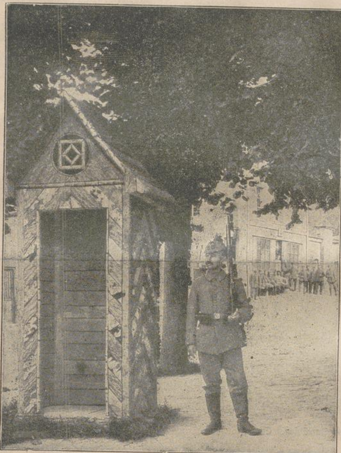
Auf der Wache in einer besetzten Stadt im Westen. (Besonders zu beachten ist das hübsch mit Birkenholz verkleidete Schilderhaus.)

Thekla eilte in die Torstube. Rosa saß schon wieder an dem Bette des kranken Mädchens und strickte. „Komm,“ rief Thekla, „du sollst den Augenblick herauf zur gnädigen Frau! Freue dich, du bekommst gewiß ein gutes Trinkgeld.“ Was Thekla vom Trinkgeld sagte, hatte Rosas feines Gefühl verletzt. Sie hatte keine Lust mitzugehen; sie wollte keinen Lohn. Indessen dachte sie, wenn sie die Einladung nicht annähme, so wäre es unfreundlich, und könnte die erfreute Mutter betrüben. Sie ging also mit Thekla.