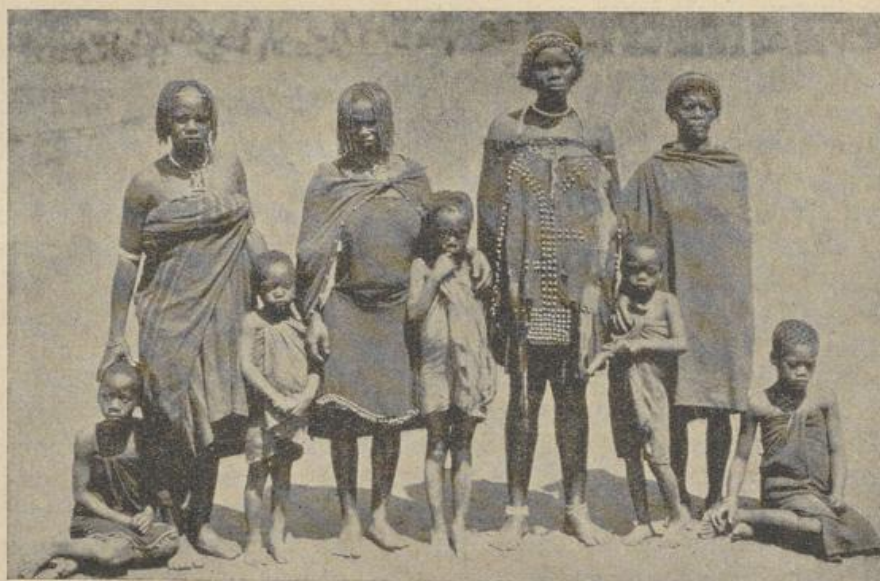
Gruppe heidnischer Frauen und Kinder

Im Jahre 1893 durchreiste der Oblatenmissionar P. Porte das Land. Seiner langjährigen Erfahrung in den südafrikanischen Verhältnissen, besonders auch im Basuto- und Betschuanalande können wir ruhig