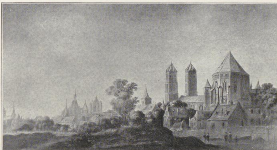
Fig. 3. Ansicht der Gereonskirche von Nordwesten auf einem Gemälde des Jan van Goyen in der Nationalgalerie zu Budapest, um 1650.

14. Jh., in 4 o . — Nr. 751. Vigiliae sive officium defunctorum secundum ordinem et ritum ill. eccles. ad s. Gereonem Col., 18.—19. Jh.