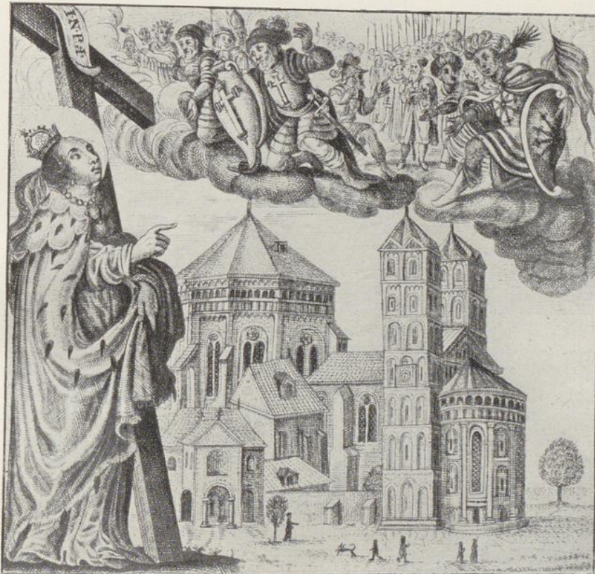
Fig. 5. Ansicht der Gereonskirche von Süden mit der h. Helena auf dem Titelbild von HILLEBRING, Pro immunitate atrii etc. 1646.

12. 1635. Auf dem Gemälde des Sebastiansaltars in der Gereonskirche zu Füßen der hl. Helena, s. S. 61 u. Taf. IX.