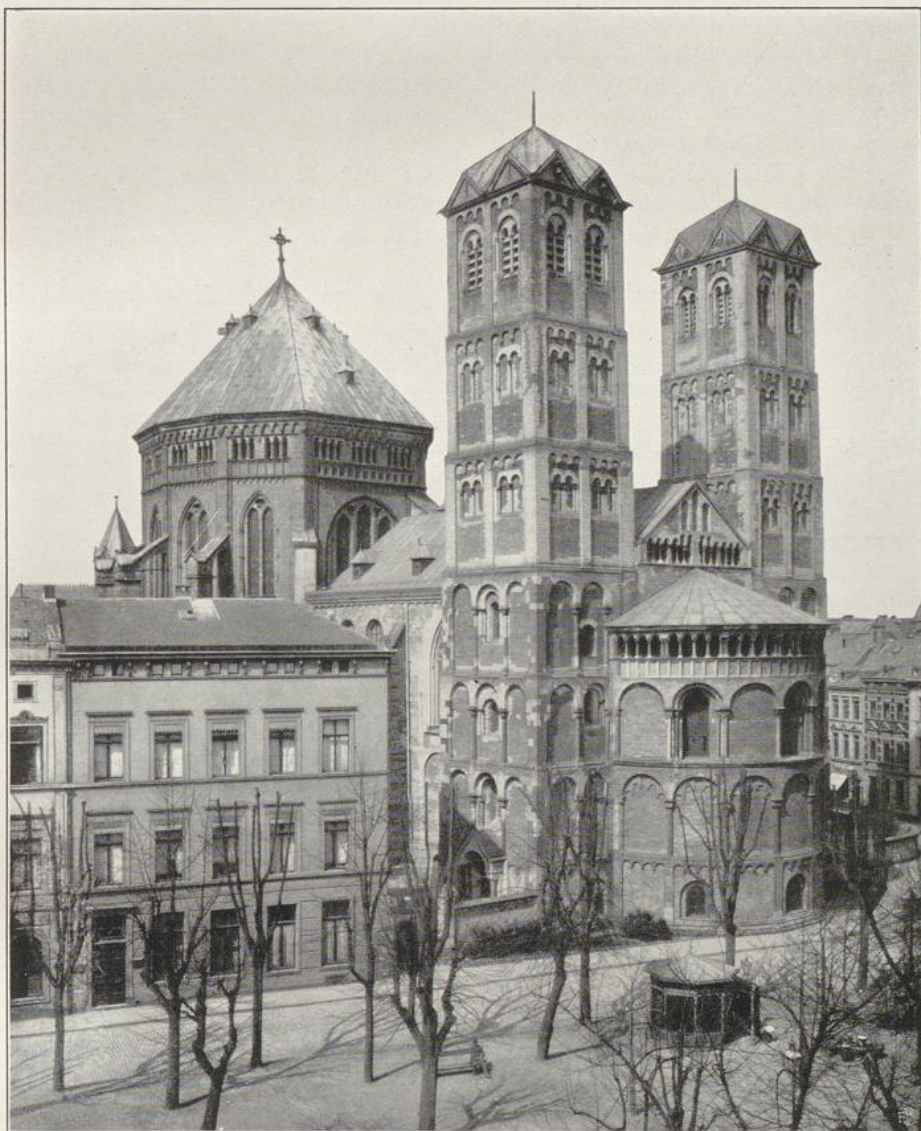
Fig. 2. St. Gereon. Ansicht von Südosten.