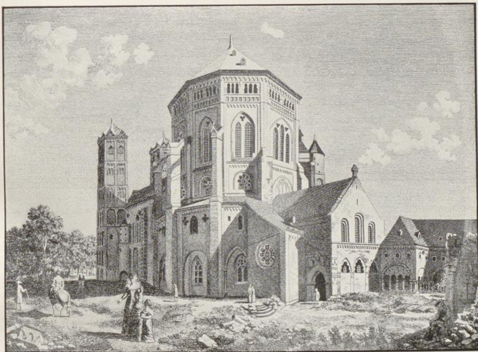
Fig. 7. St. Gereon von Nordwesten nach teilweisem Abbruch des Kreuzgangs. Lith. von Adolph Wallraf um 1814.

48. c. 1840. Ansicht von Süden. Aus: D. RAMEE, Le Moyen-Age Monumental et Archéologique, 1843 Paris, Nr. 325. Bez.: Daniel Ramée DEL. ET LITH. LMP. LEMERCIER A PARIS. Lith. [Zg. 20,6×29,3. [913]