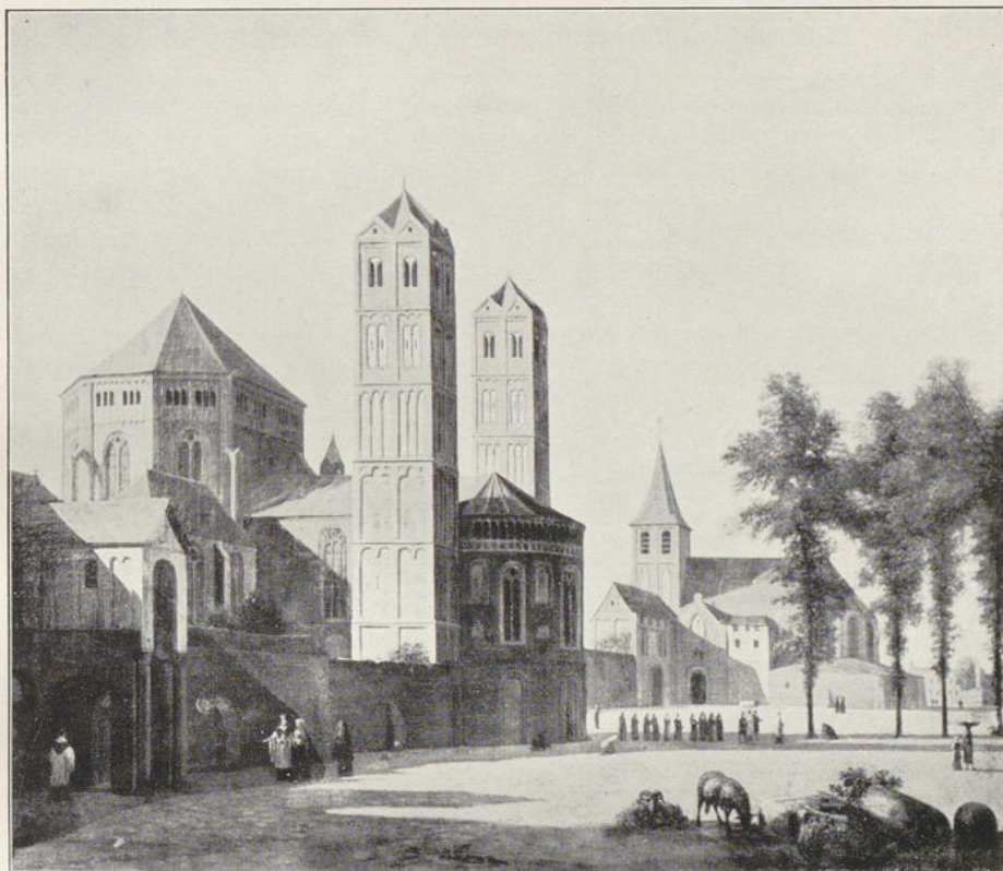
Fig. 6. St. Gereon und St. Christoph. Gemälde von Job Berckheyde, um 1670.

27. c. 1800. Ansicht von Osten, im Hintergrund eine Ansicht des Gereonsdriesches. Bez.: ANSICHT DES ST. GEREONS PLATZ IN COLLN; dasselbe italienisch und französisch. AUGSBURG BEY JOS. CARMINE. Kolor. Kpfrst. Zg. 27,6×40. 19. Jh. [927]