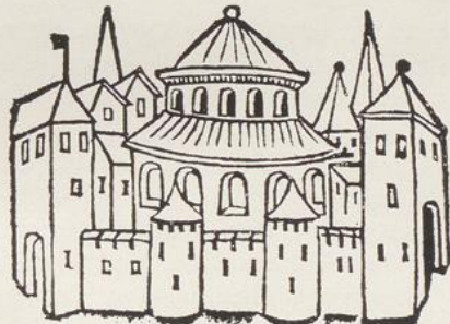
Fig. 1. Ideale Darstellung eines Rundbaus in Rolewincks Fasciculus Temporum (Köln 1474), in der Koelhoffschen Chronik (1499) für St. Gereon benutzt.

Sent Gereons kyrche tzo Coellé hait doyn maché die keyserinne Helena.