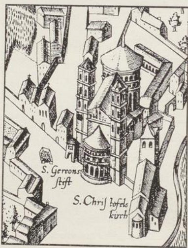
Fig. 4. Ansicht der Kirche St. Gereon auf dem Stadtplan Mercators v. J. 1571.

3. c. 1460. Auf dem Triptychon Rogers van der Weyden mit der Anbetung der drei Könige in der Münchener Pinakothek (Nr. 101—103) ist auf dem Mittelbild ein Teil des Äußern, auf dem rechten Flügel mit der Darstellung Jesu der Innenraum eines Zentralbaues dargestellt, der — wenigstens bezüglich des Äußern — eine entfernte Ähnlichkeit mit dem Dekagon von St. Gereon zeigt. Das Triptychon entstammt der Wasserfaßkapelle von St. Kolumba in Köln.