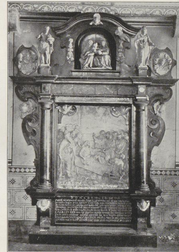
Fig. 79. St. Johann Baptist. Aufsatz vom ehem. Annenaltar.

Die romanischen Teile sind in dem üblichen ziegelmäßig vermauerten Tuffsteinmaterial ausgeführt, die älteren gotischen Anbauten auf der Nordseite aus Tuffstein, bzw. Tuff und Ziegel gemischt, die jüngeren auf der Südseite nur aus Ziegel, ebenso die Giebel der Westseite und die oberen Teile des Turmes.