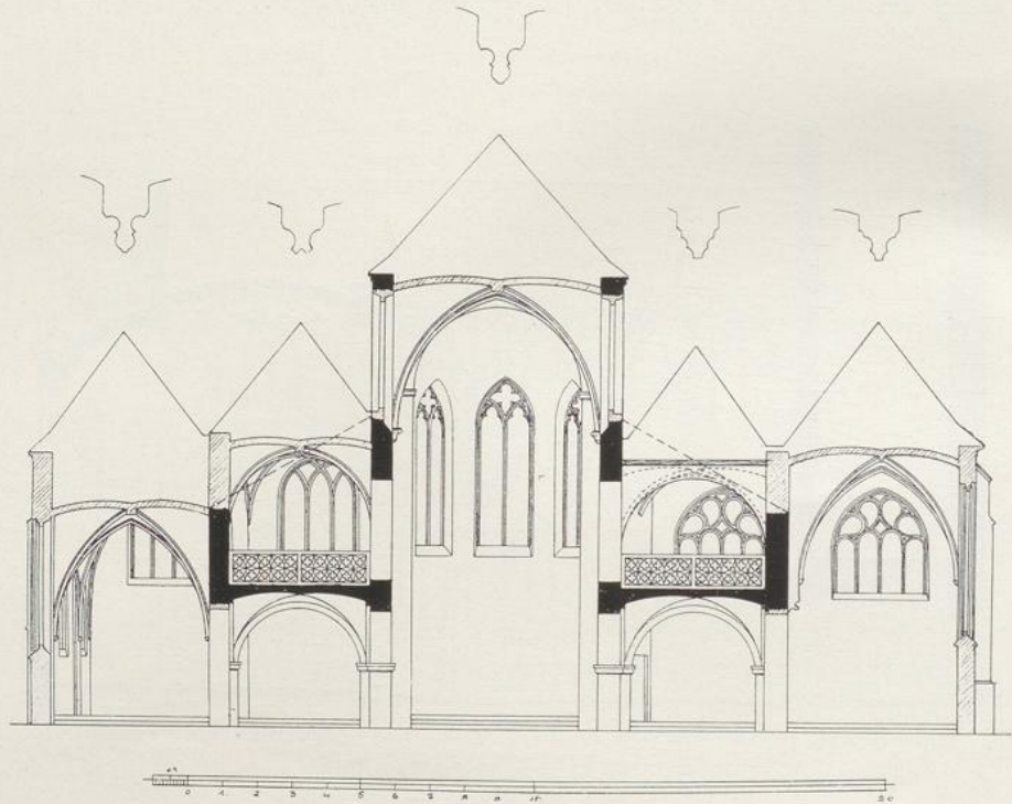
Fig. 78. St. Johann Baptist. Querschnitt durch die Emporen.

Inneres hohe Eckblattbasen und kräftig modellierte spätromanische Laubkapitäle (Fig. 76) An das Kämpferprofil des Stirnbogens nach dem Mittelschiff stösst unvermittelt der Kämpfer der einzigen beiderseits noch erhaltenen unteren Arkade des Mittelschiffs (Fig. 77). Das stark ausgeschweifte Profil, das sich ähnlich so am Triumphbogen wiederholt, lässt aber nicht zu, diese Teile noch dem älteren Bau vor 1200 zuzuschreiben. Von den ursprünglichen drei Zwischenpfeilern auf jeder Seite sind nur noch je zwei erhalten. Über den Pfeilern steigen Lisenen auf, die unter der ehemaligen flachen Decke mit einzelnen Rundbögen verbunden waren, von deren Bemalung sich noch Reste über den Gewölben erhalten haben. (Eine ähnliche Anordnung in St. Kastor in Koblenz, dort allerdings bereits Spitzbögen,