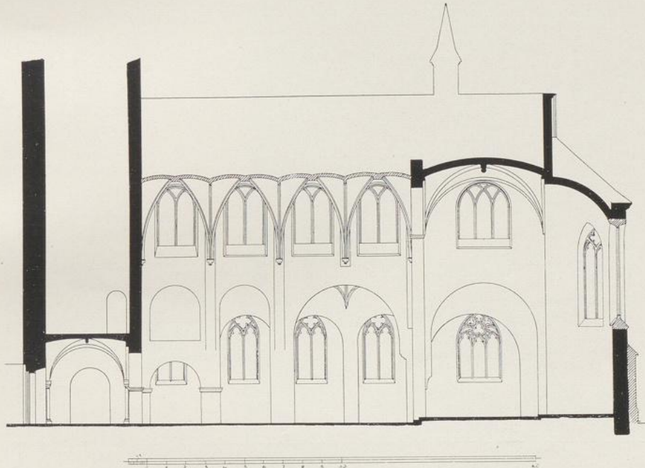
Fig. 77. St. Johann Baptist. Längenschnitt.

Der Obergaden des Mittelschiffs hat Rundbogenfries und Lisenenteilung, ebenso die Apsis. Das Profil des Traufgesimses besteht aus Kehle und Viertelstab. Romanische Fenster oder deren Spuren sind nicht mehr sichtbar. Die jetzigen Fenster des Mittelschiffs scheinen dem 16. Jh. anzugehören. Unter dem Rund-