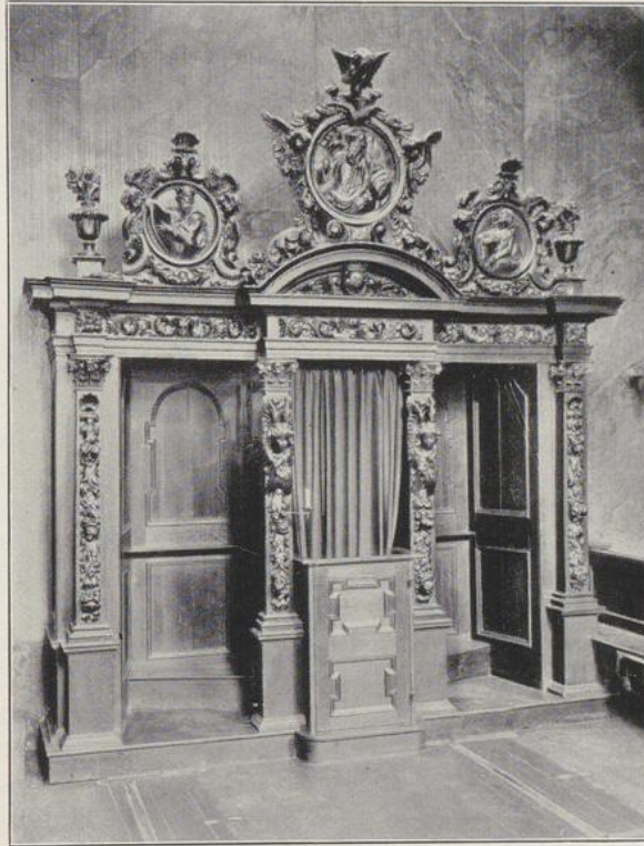
Fig. 198. St. Maria in der Kupfergasse. Beichtstuhl.

Kreuzigungsgruppe , an einem Pfeiler der Westseite. Holz, Kruzifix mit Maria und Johannes, unbedeutende Arbeit vom Anfang des 16. Jh., besonders schwach der schief sitzende Kopf des Johannes. Das Kreuz und die Konsolen unter den Figuren sind neu.