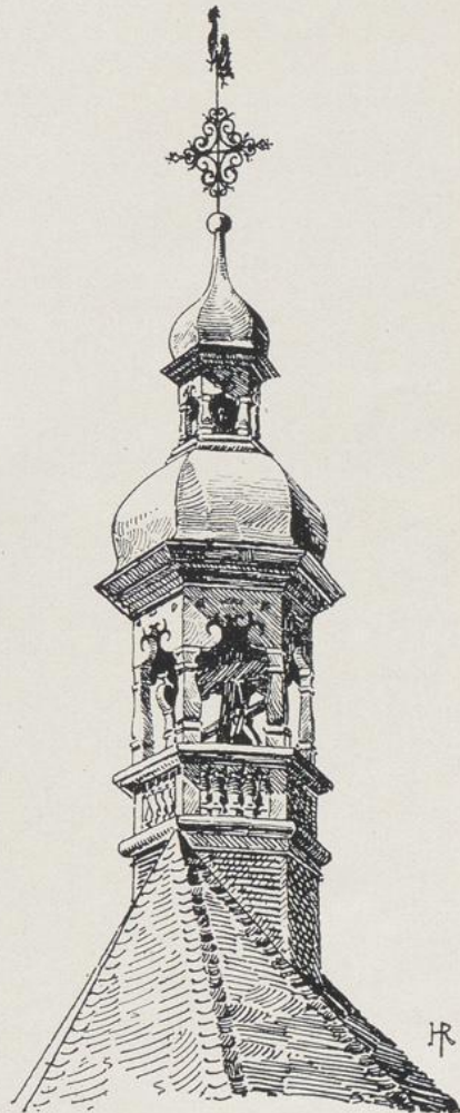
Fig. 196. St. Maria in der Kupfergasse. Dachreiter.

Kommunionbank, in geschweifter Form aus mehrfarbigem Marmor mit gut profilierten quadratischen Balustern und einer schönen schmiedeeisernen Rokokotür.