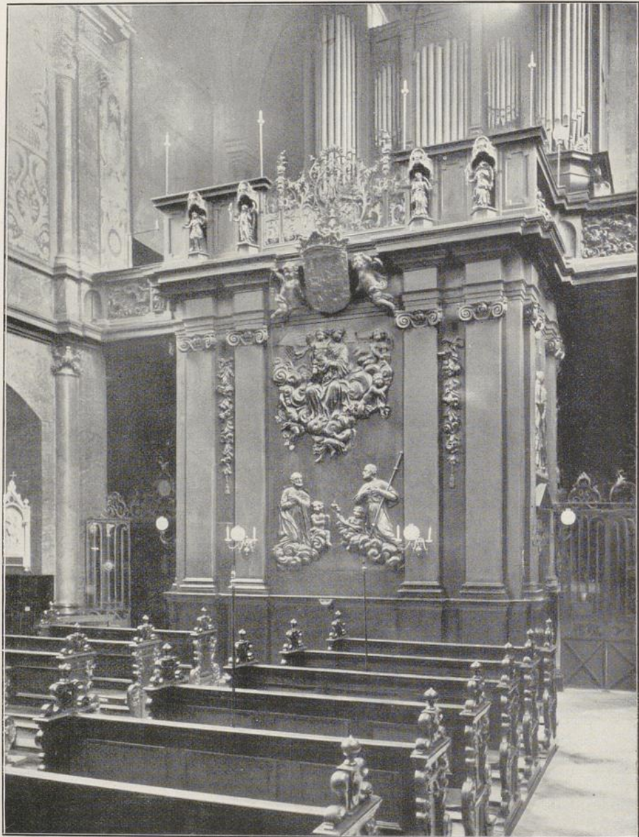
Fig. 197. St. Maria in der Kupfergasse. Loretokapelle.

Das Gestühl mit barock verzierten Wangen gehört zur Einrichtung der Kirche vom J. 1715. Auf mehreren Stühlen Alliancewappen (Adler und mit 3 Kugeln besetzter Sparren) mit den Buchstaben L. C. und M. B.