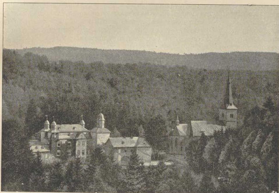
Fig. 1. Schloss Gimborn. Ansicht von Nordwesten.

Die drei anderen Ecken des Herrenhauses sind um eine Geschosshöhe über das Hauptgesims als kräftige Ecktürme hochgeführt; sie tragen der Bedachung des Hauptturmes entsprechende geschweifte Hauben mit Laternen. Alle Türme haben Wetterfahnen mit dem Schwarzenbergischen Wappen. Das Herrenhaus selbst mit einem hohen Mansarddach des 18. Jh.; durchweg einfache grosse Fenster des 18. Jh. An der Westseite springt ein zweifensteriger Risalit mit einem grossen geschweiften Giebel in Fachwerk vor (Fig. 1); an diesem die Jahreszahl 1719, unten am Mauerwerk die Jahreszahl 1701. Nördlich neben diesem Risalit die ursprüngliche rundbogige Thoröffnung mit den Rollen für die Zugbrücke, jetzt im Inneren zur Kapelle umgestaltet. Neben dem Thor das Schwarzenbergische Wappen mit der Inschrift: ADAM GRAVE ZU SCHWARTZENBERGH, HERR ZU GIMBORN UND HOHENLANTZBERGH, KO. MAYT. ZU FRANCKREICH ST. MICHAELIS ORDENSRIITTER.