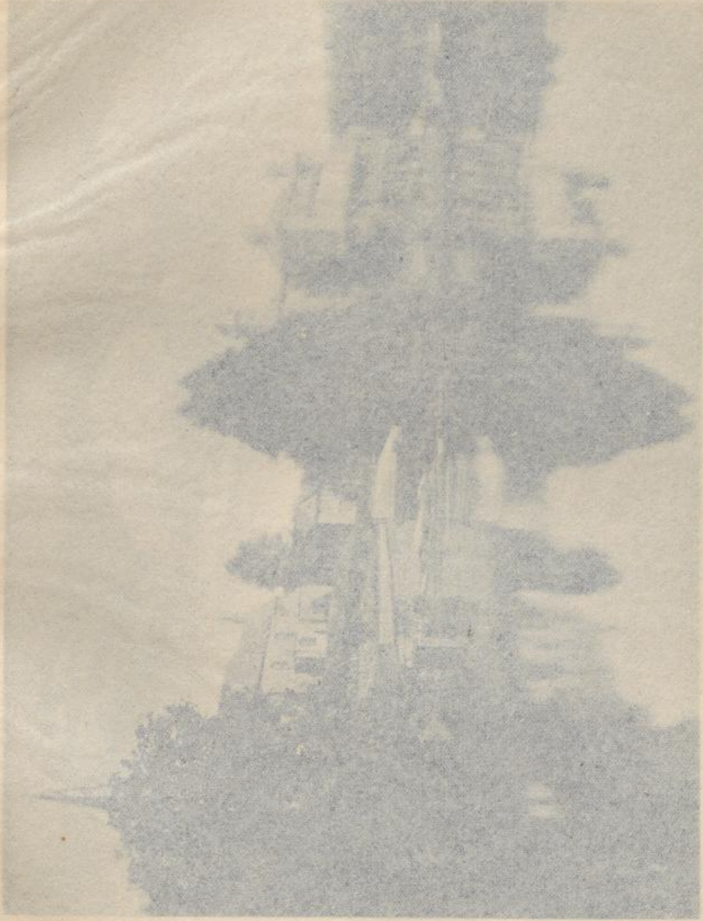
Stupa in Gandhara, Gandhara, India