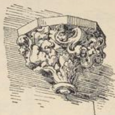
Fig. 38. Wimpfen a. B. Konsole vom ehemaligen gothischen Gehäuse der Kreuzigungsgruppe.