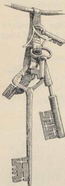
Fig. 91. Wimpfen a. B. Schlüssel der ehemal. Stadthore im Stadtarchiv.

lichen Wimpfener Adler läuft die gothische Minuskel-Randschrift: ſigillum (ecclesiae?) wimpenenſis und die Jahreszahl 1458. (Fig. 90.)