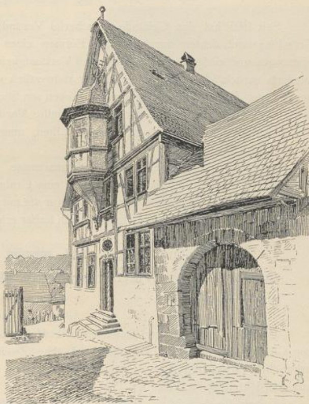
Fig. 96. Wimpfen a. B. Erkerhaus des Bürgermeisters Ellseeser in der unteren Blauthurm-gasse.