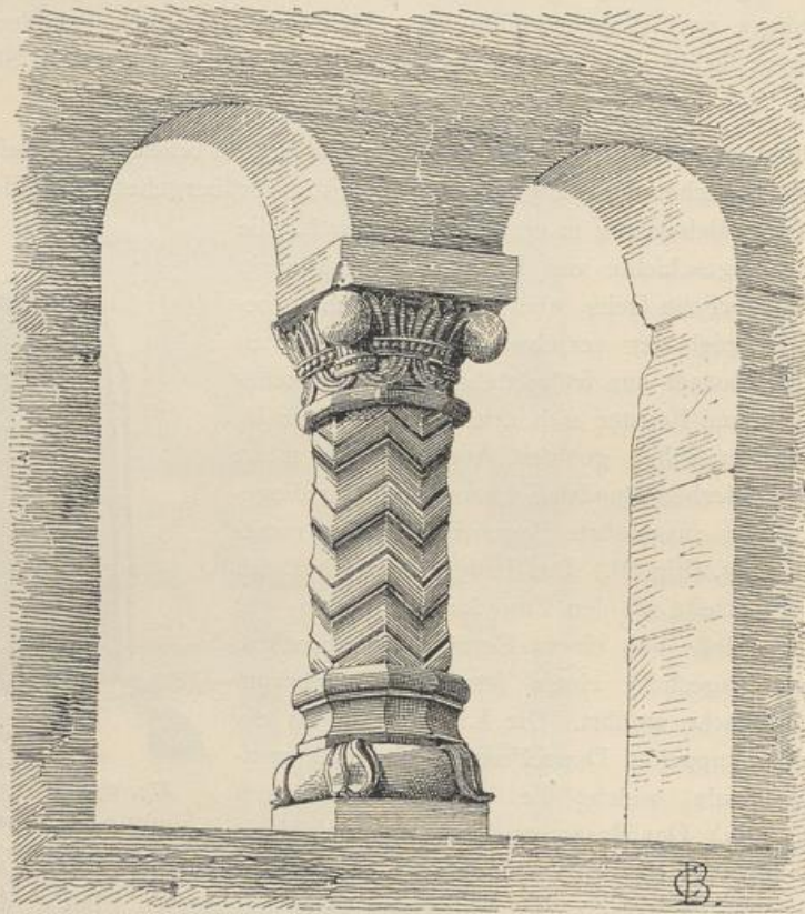
Fig. 95. Wimpfen a. B. Fenster eines romanischen Hauses in der Schweißbogenstrasse.

nebst Wappenschmuck auf den Beginn des 18. Jahrhunderts deuten. Die beiden Thorpfeiler sind auch dadurch beachtenswerth, dass ihre Bossage-Werkstücke mit verschiedenen vertikalen Einschnitten, sogenannten Längsrillen bedeckt sind, dergleichen vielfach an kirchlichen und profanen Bauten des Mittelalters vorkommen. Der in Rede stehende Fall zeigt, dass Längsrillen auch dem Barocco nicht fremd sind. Die Erscheinung ist wohl geeignet, die Ansicht Derer in's Wanken zu bringen,