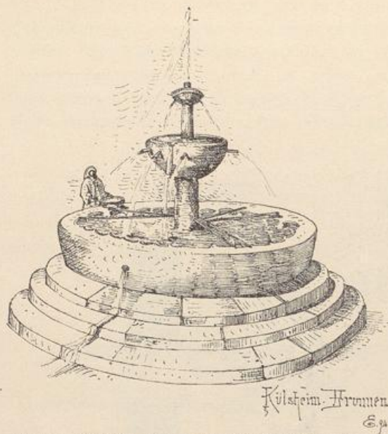
Fig. 59. Kilsheim. Brunnen bei der Katharinen-Kapelle.