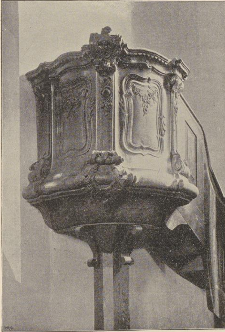
Fig. 63. Niklashausen. Kanzel.

Philipp Eucharius von Stettenberg (s. unten Grabmal des Stifters) neu gegründet, war die Kirche kaum in den unteren Theilen bis über die Fenster vollendet, als der Bau unterbrochen und nur das Schiff nothdürftig vollendet wurde. Der in Folge