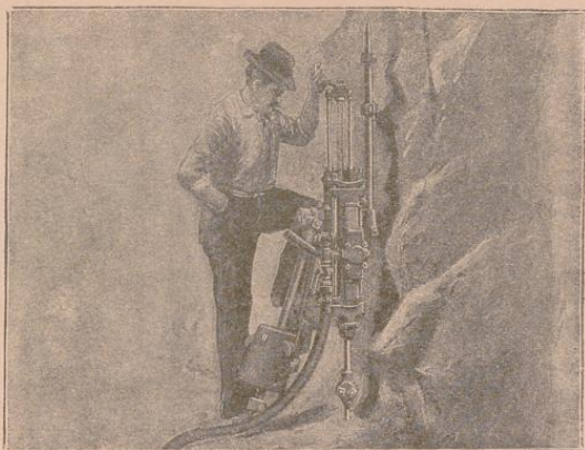
Ingersoll-Sergeant Gesteins-Bohrmaschine arbeitet dicht an einem Felsen.