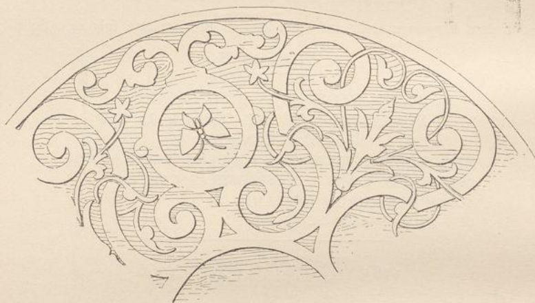
Abb. 184. Stück einer Tischplatte.

Siglen, die als (Graf zu Schaumburg-Lippe und Sternberg) leicht zu lesen sind. Uebrigens ist dieses Schloß in kunstformaler Hinsicht nicht merkwürdig. Nur ein Tisch, von dessen Platte Abb. 184 ein sich wiederholendes Stück darstellt, verdient einige Beachtung.