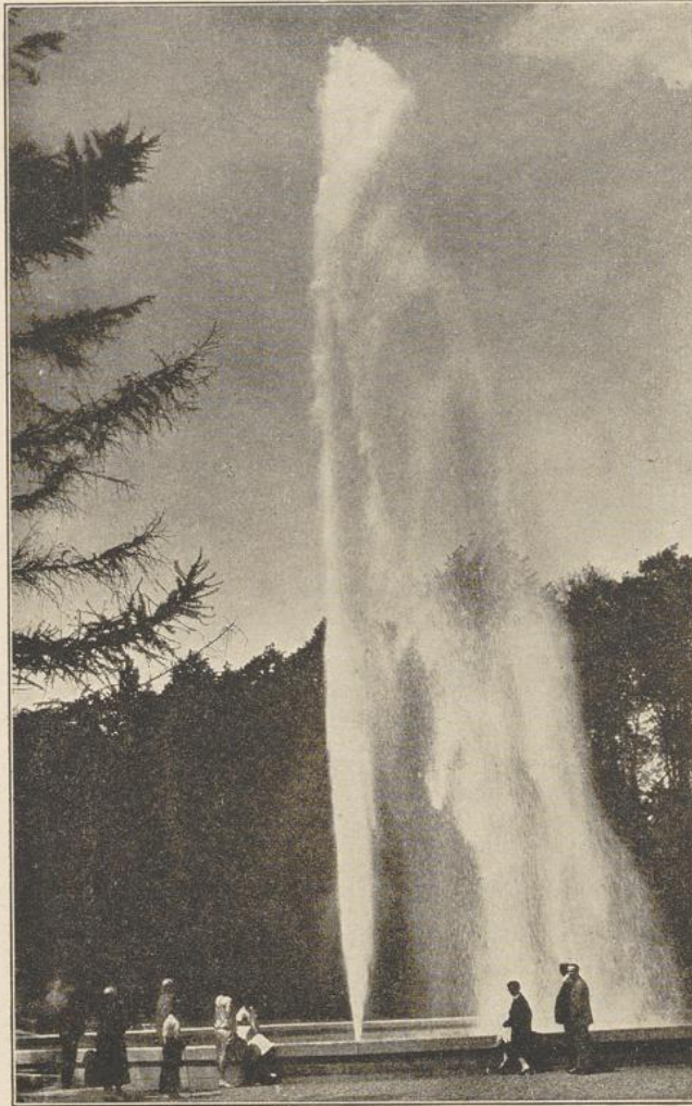
Der neu erbohrte heiße Jordansprudel in Bad Deynhausen, über 44 m hoch

Wahrscheinlich ist dieser Riesenprudel eine Ver-