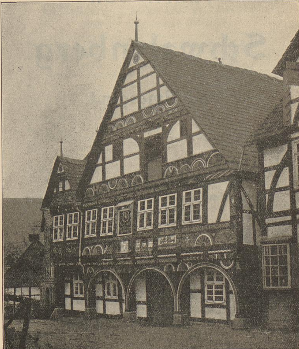
Rathaus im Jahre 1906