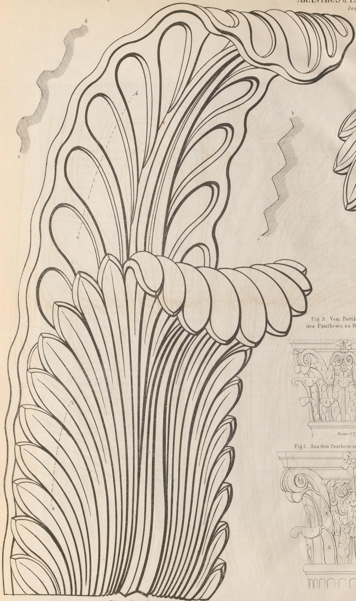
Fig 3. Vom Portikus des Pantheon zu Rom.