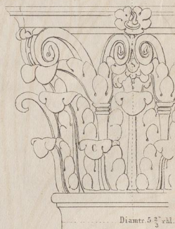
Fig 1. Aus dem Pantheon zu Rom.