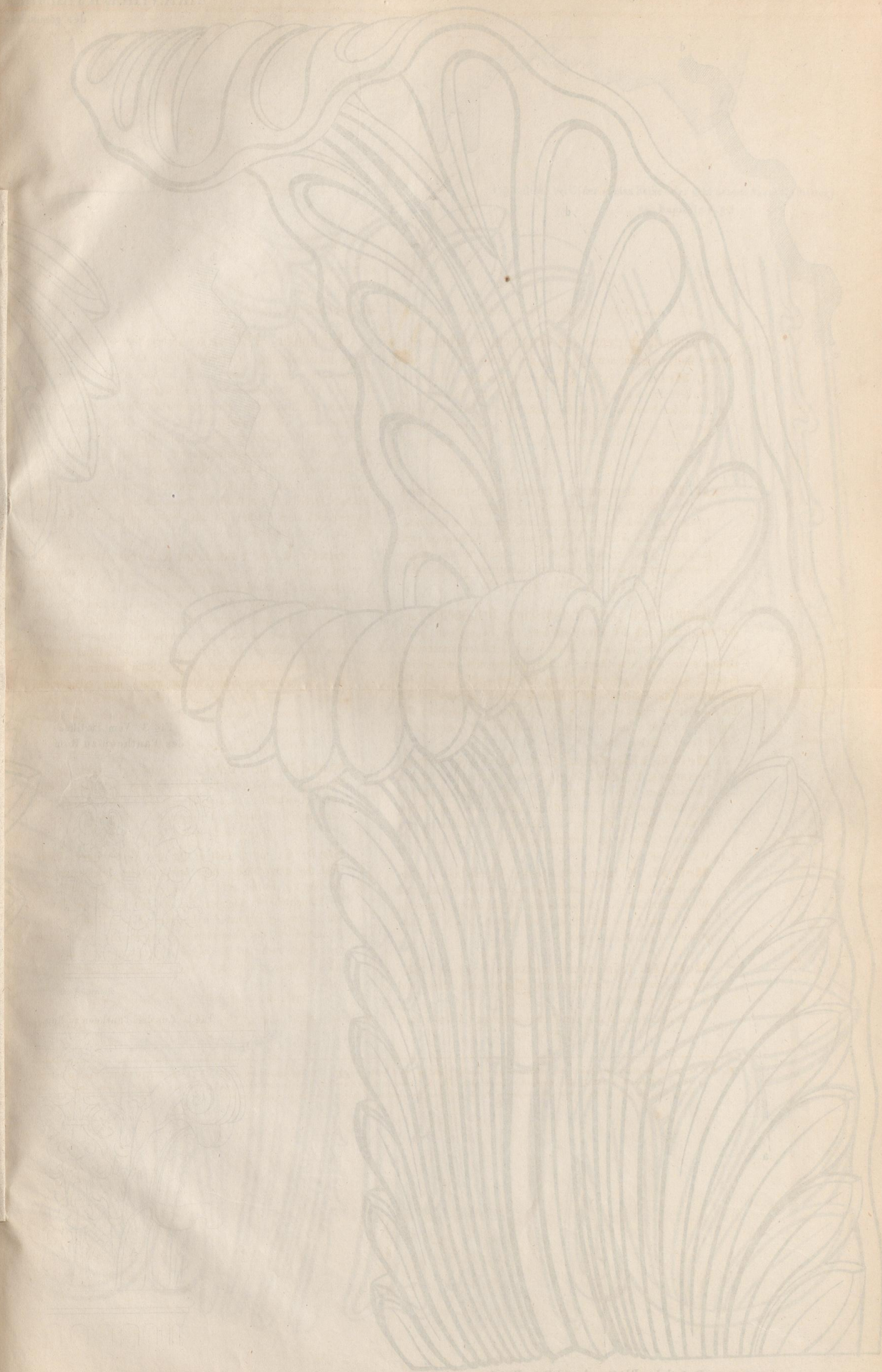
Detail der Blätter 2 und 8 in Fig. 1