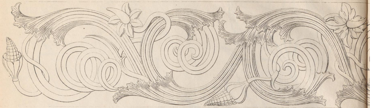
Fig. 10. Detail des Endstückes eines