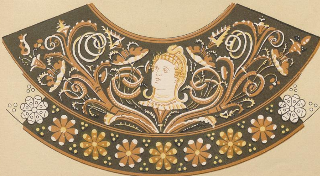
2. Ornament von einem Räuchergefäß (Ansatz des Bauches unter dem Halse.) \frac{1}{2} natürl. Gröfse.