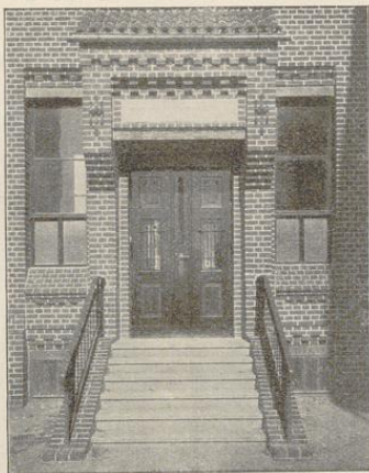
Fig. 83. Seiteneingänge auf der Nord- und Südfront des Hauptgebäudes.