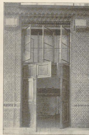
Fig. 82. Einfahrtstor zur Prüfungshalle in der westlichen Versuchsstätte. (Rm 83.)

Es kostete die Tischlerarbeit für ein fünfteiliges Einfahrtstor mit Oberlicht: 460 M. und der Beschlag dazu: 160 M.