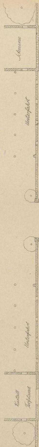
Abb. 188. Grundriß.