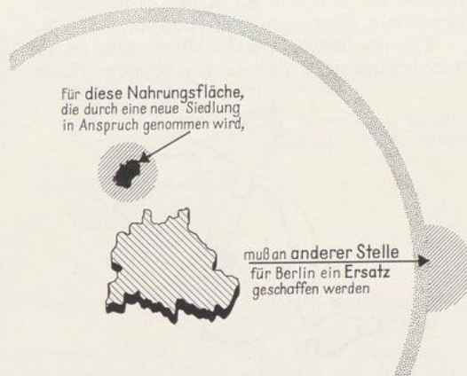
Abb. 29. Der Nahrungsraum der Stadt. Das Bild zeigt Berlin, dessen Nahrungsreis einen Radius von 100 km hat.

Zur Erklärung der gezeigten Kreisdarstellungen, auch der folgenden, sind noch einige Angaben notwendig. In den Abbildungen ist die Fläche des ganzen Verwaltungskreises durch einen großen Kreis im Maßstab 1:750000 dargestellt. Die Fläche der Kreisstadt ist ebenfalls im selben Maßstab gezeichnet worden, um den flächenmäßigen Anteil der Kreisstadt selbst