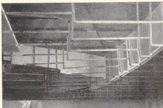
Bild 762. Flacheisenkonstruktion für den Entlüftungskanal