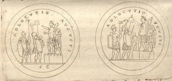
Lib. xvii. Agnosceis ubique circumdatum Aquilis signisque Tribunal, ut de eo Tacitus aliique loquuntur, & quem ritum sæpius præ aliis tangit Ammianus, Constantius Sarmaticus dictus

Neque alienæ ab hoc loco ADLOCUTIONES, seu Conciones illæ militares, quarum memoriam & ritum tot præclari Cæsarum Nummi conservarunt. Hinc nempe Suggestus seu Tribunal juxta Plinium, viridicepitate extructum; stans in eodem Imperator stipatus prætorianorum Præfecto, infra milites cum Aquilis & Signis, ac Inscriptiones, ADLOCUTIO vel ADLOCUTIO COH. seu Cohortis; ADLOCUTIO MILITUM; ADLOCUTIO AUGUSTI vel AUGUSTORUM; tot enim modis designantur, & cujus generis duo hic habes ectypa è Cimeliarchio inclytæ Reginae deprompta.