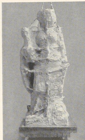
Bild 540. Tonmodell 3-5 cm stark mit Gips ummantelt