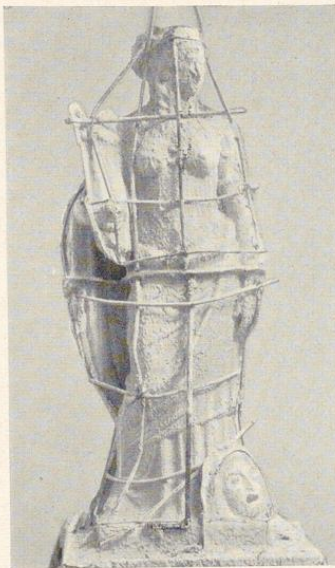
Bild 539. Das Modell mit rot gefärbtem Gips dünn vorgespritzt. Die Eisenarmierung für die Formschalen wird mit in Gips getauchtem Rupfen gebunden