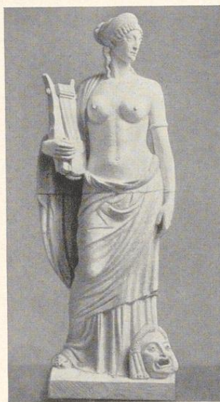
Bild 542. Fertige Plastik, in weißem Zement mit Zusatz von Naturmarmor gestampft, vor der Überarbeitung

Mund hauchartig mit Wasser übersprüht, dadurch werden porenfreie und glatte Negative erzielt.