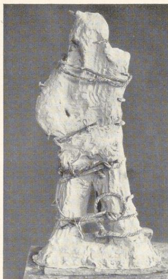
Bild 543. Verlorene Form für den Gipseinguß auf der Polsterbank vorbereitet. Die mit Faden geteilte Form ist geseift, gewässert, mit Stricken gebunden und mit Klammern zusammengehalten. Die Form wird nach Erhärtung des Gusses mit Meißel und Holzhammer abgeschlagen

Nach vollständiger Erhärtung wird die Form mit dem Meißel vorsichtig auseinandergetrieben, dann zum Guß, wie schon