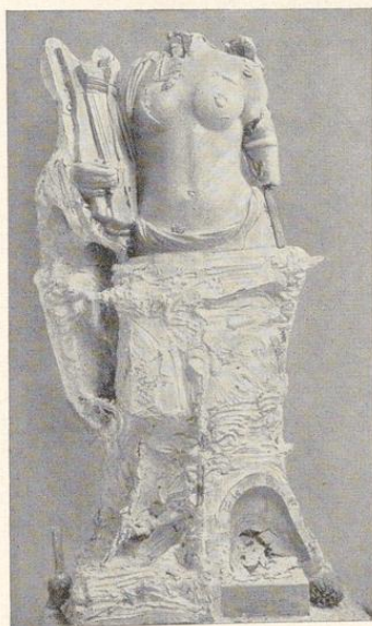
Bild 541. Abnehmen der einzelnen Formschalenteile