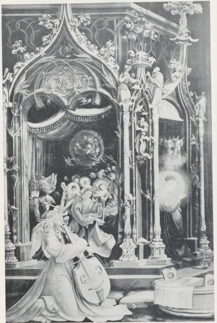
84. Grünewald, Vom Isenheimer Altar.