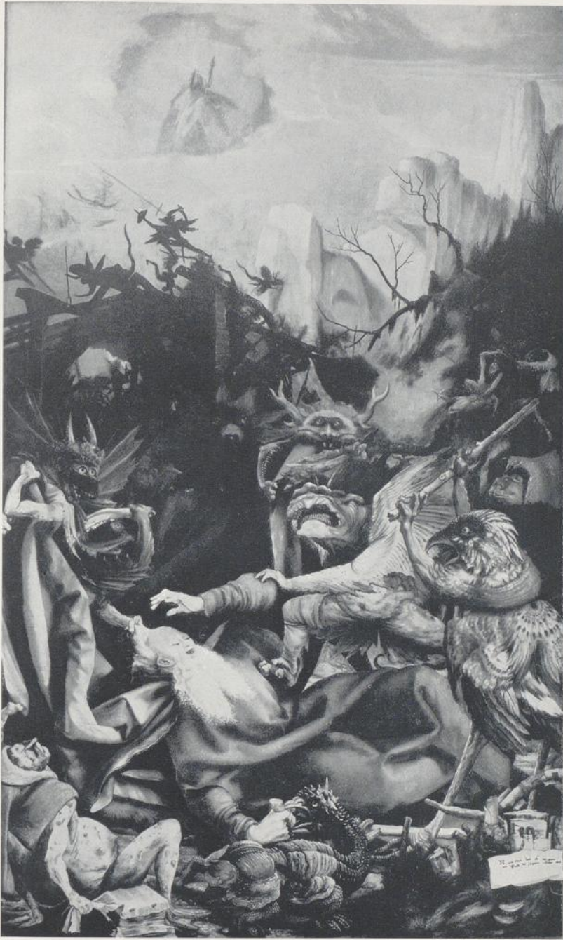
90. Grünewald, Vom Isenheimer Altar: die Versuchung des hl. Antonius.