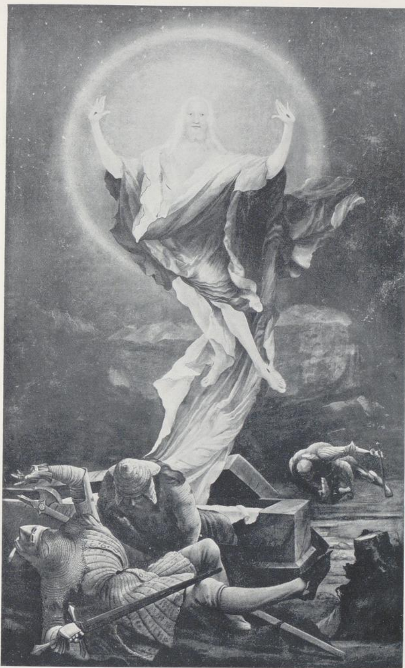
88. Grünewald, Vom Isenheimer Altar.