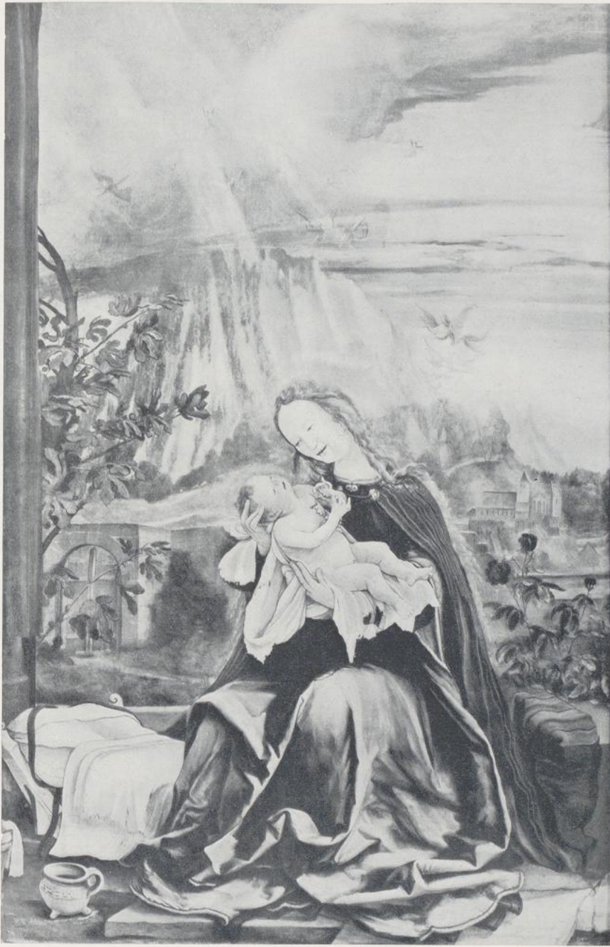
85. Grünewald, Vom Isenheimer Altar.