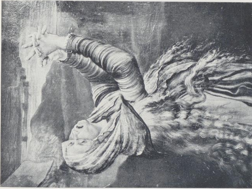
81. Grünewald, Heilung einer Besessenen.