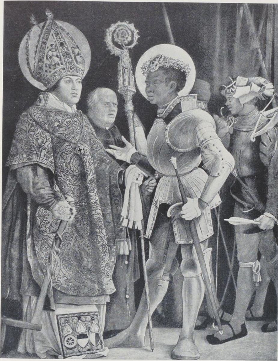
92. Grünewald, Mittelbild des Halleschen Altars, gegen 1525, jetzt in München.