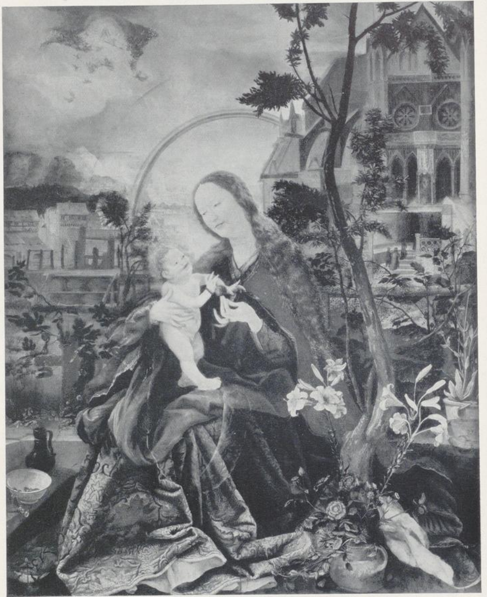
91. Grünewald, Madonna in Stuppach.