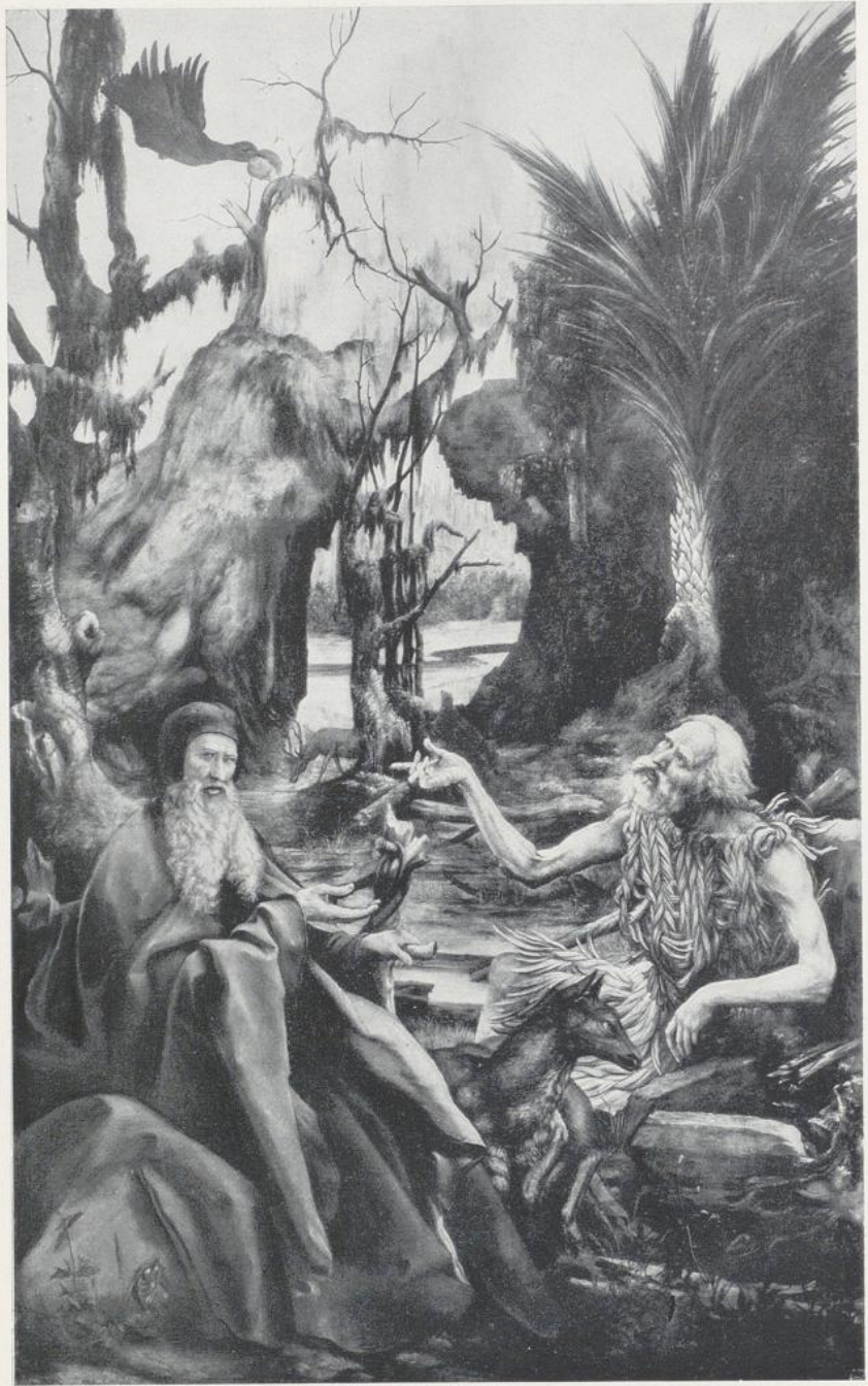
89. Grünewald, Vom Isenheimer Altar: die hl. Einsiedler Antonius und Paulus.