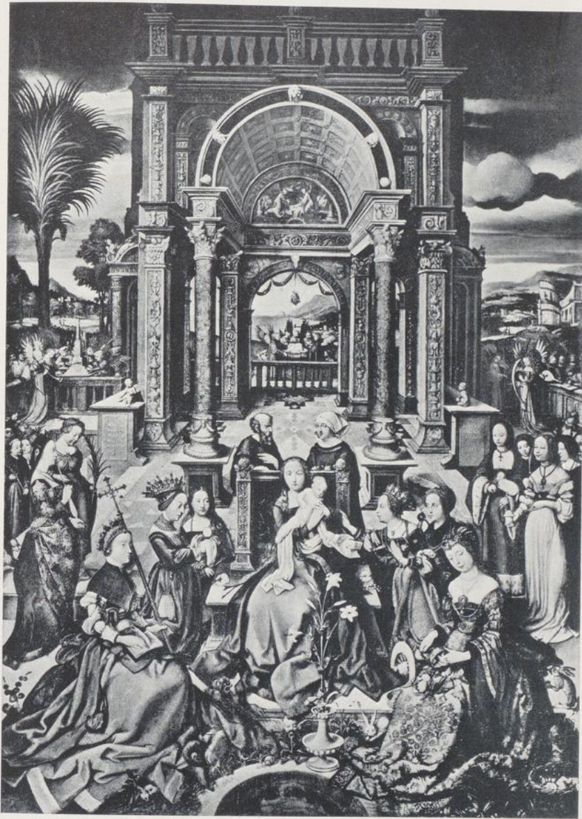
153. Holbein d. Ä., Der Lebensbrunnen, Altarbild, 1519, jetzt in Lissabon.