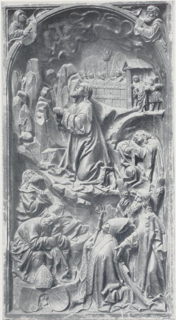
222. Hans Bäuerlein, Epitaph über dem Grabe des Bischofs Heinrich von Lichtenau († 1517) im Dom zu Augsburg, Rotmarmor, ausgeführt vor 1509.