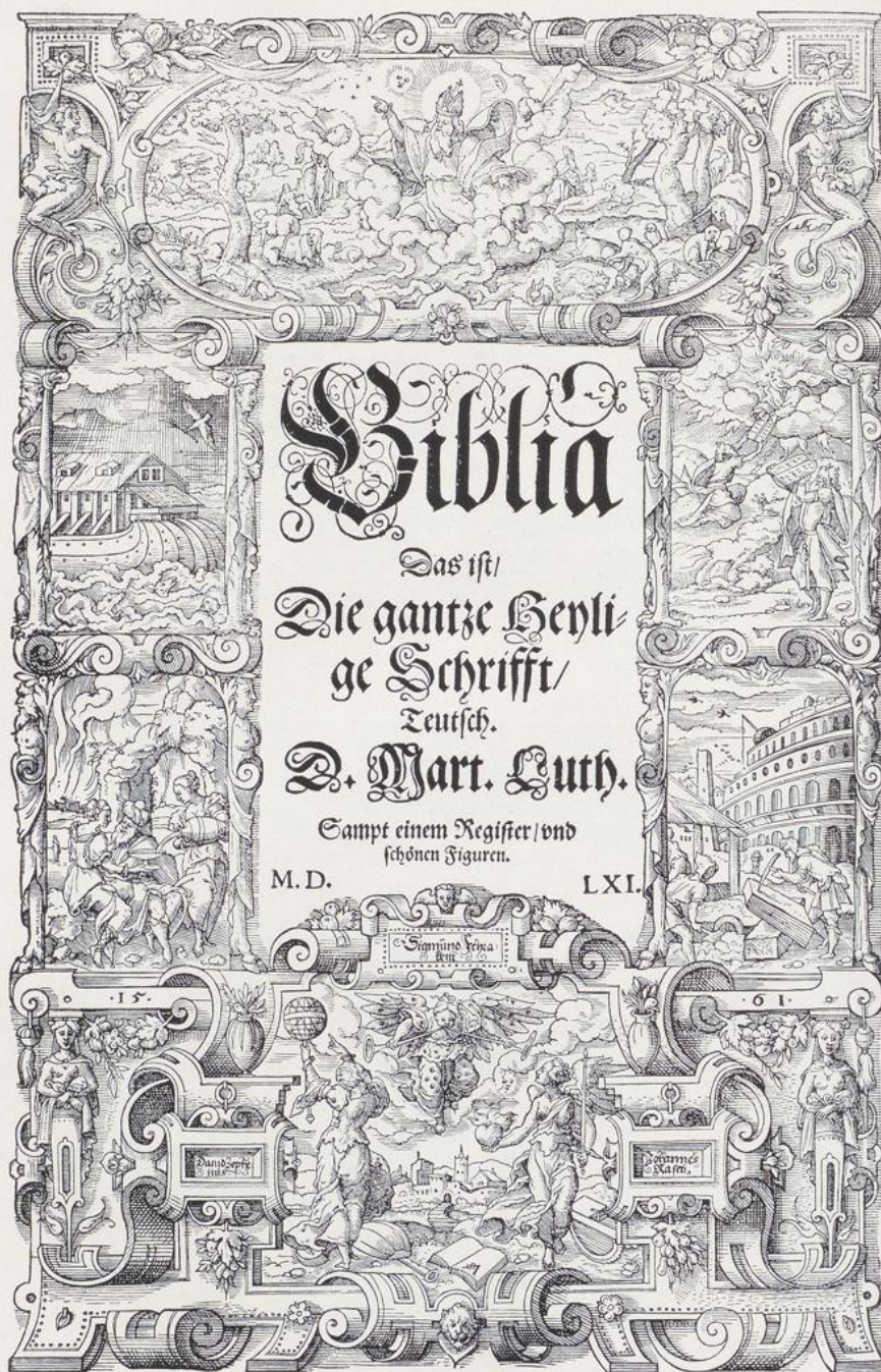
423. Virgil Solis, Titelblatt zur Frankfurter Bibel, Holzschnitt, 1561.