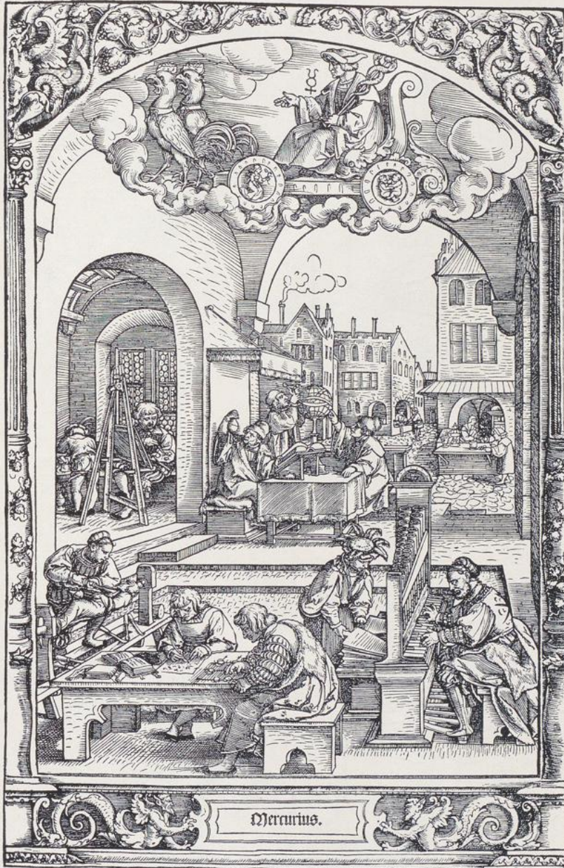
418. Georg Pencz, Aus der Folge der Planetenbilder, Holzschnitt (früher H. S. Beham zugeschrieben).

Im 3 6 7. tagen lauff Verding ich meinen lauff vnd gang.