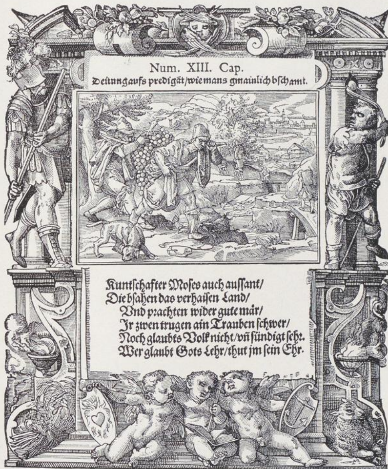
424. Tobias Stimmer, Aus der Baseler Bibel, Holzschnitt, 1576.