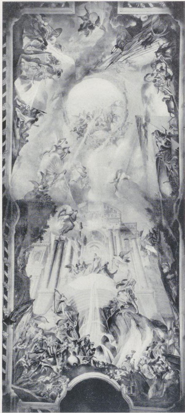
714. C. D. Asam, Die hl. Jungfrau vermittelt den Weltteilen das Licht des Glaubens, Deckengemälde in Ingolstadt, Maria-Viktoriaaal, 1736.