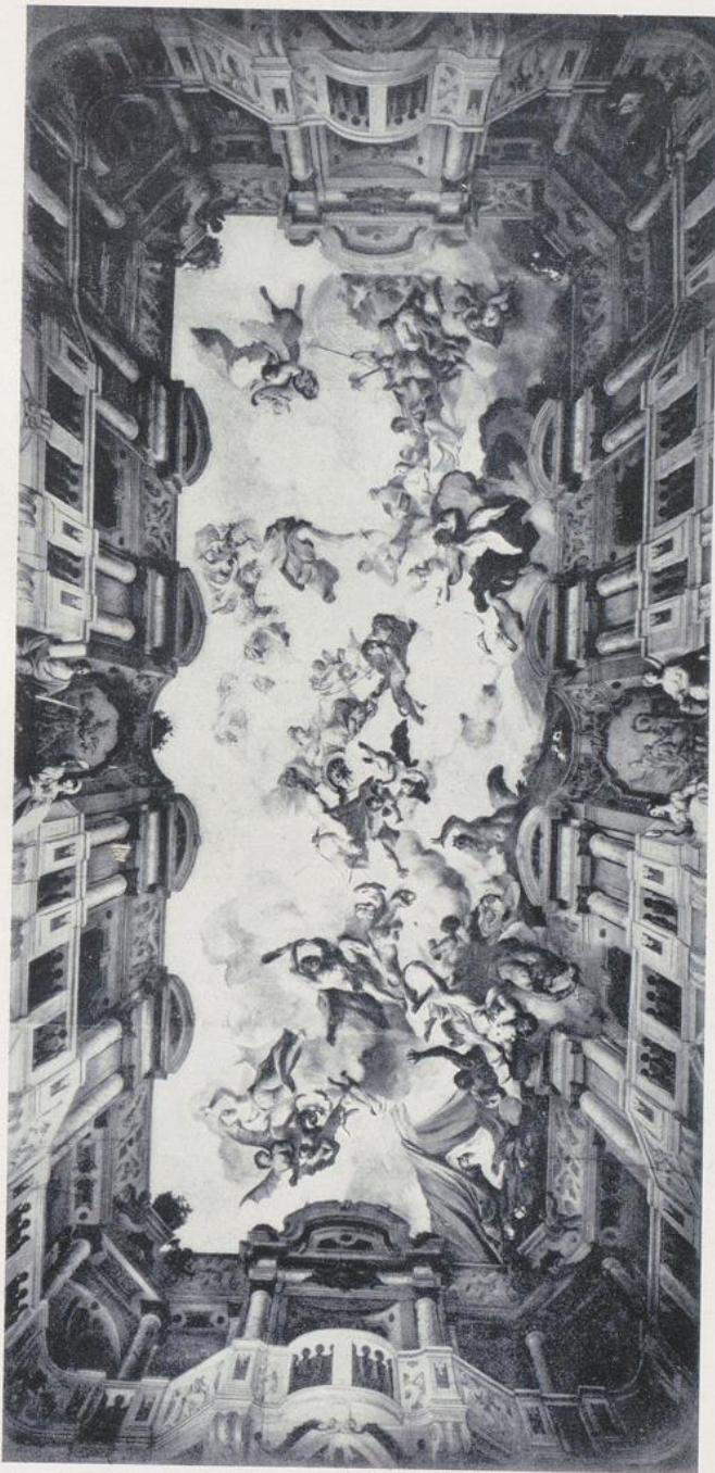
713. Paul Troger, Deckengemälde im Stift Melk, um 1720.