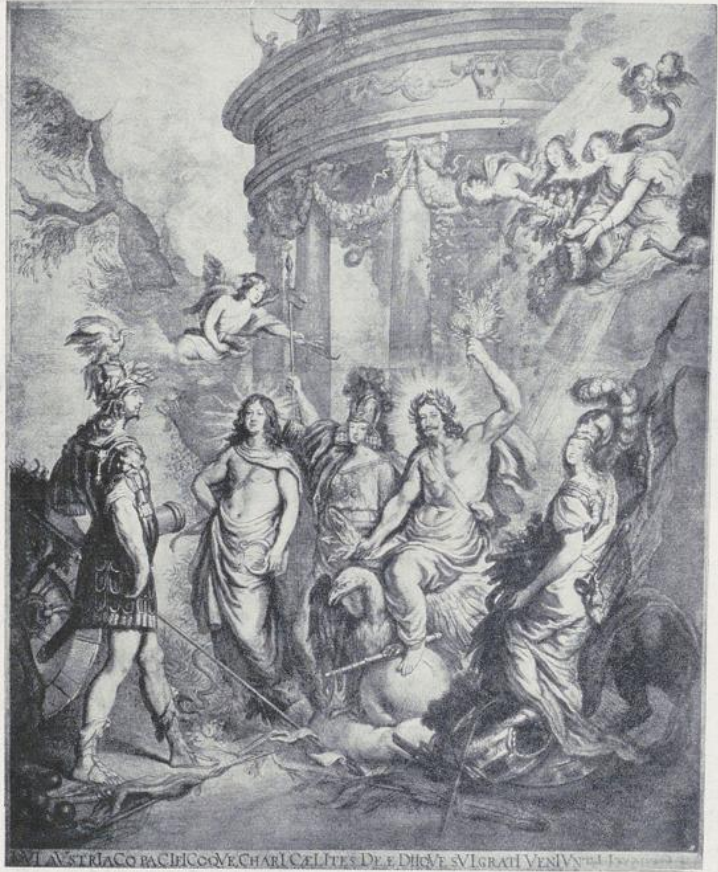
705. Sandrart, Kaiser Ferdinand III. als Jupiter.