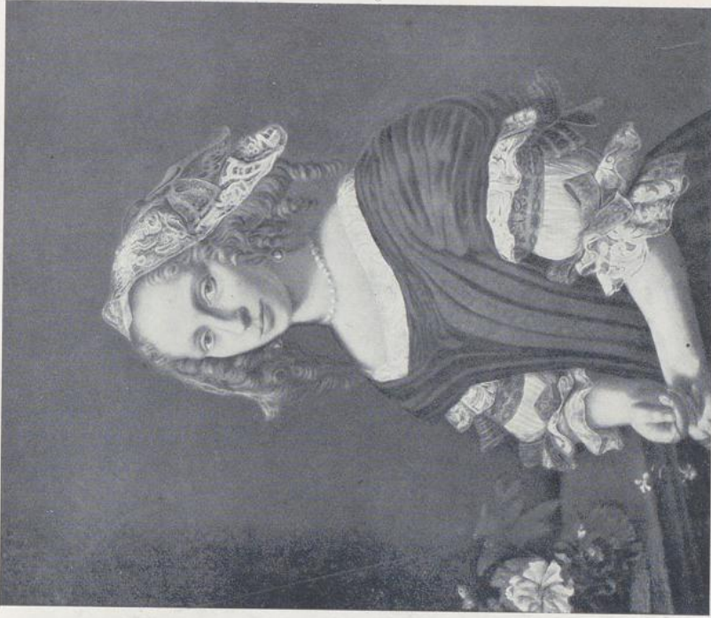
706. Johann Heinrich Roos, Bildnis eines Unbekannten.