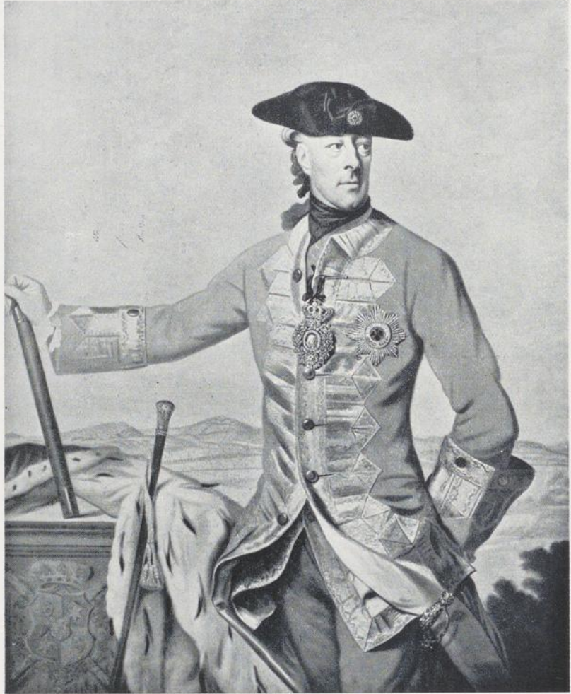
712. Ziesenis, Graf von Schaumburg-Lippe.