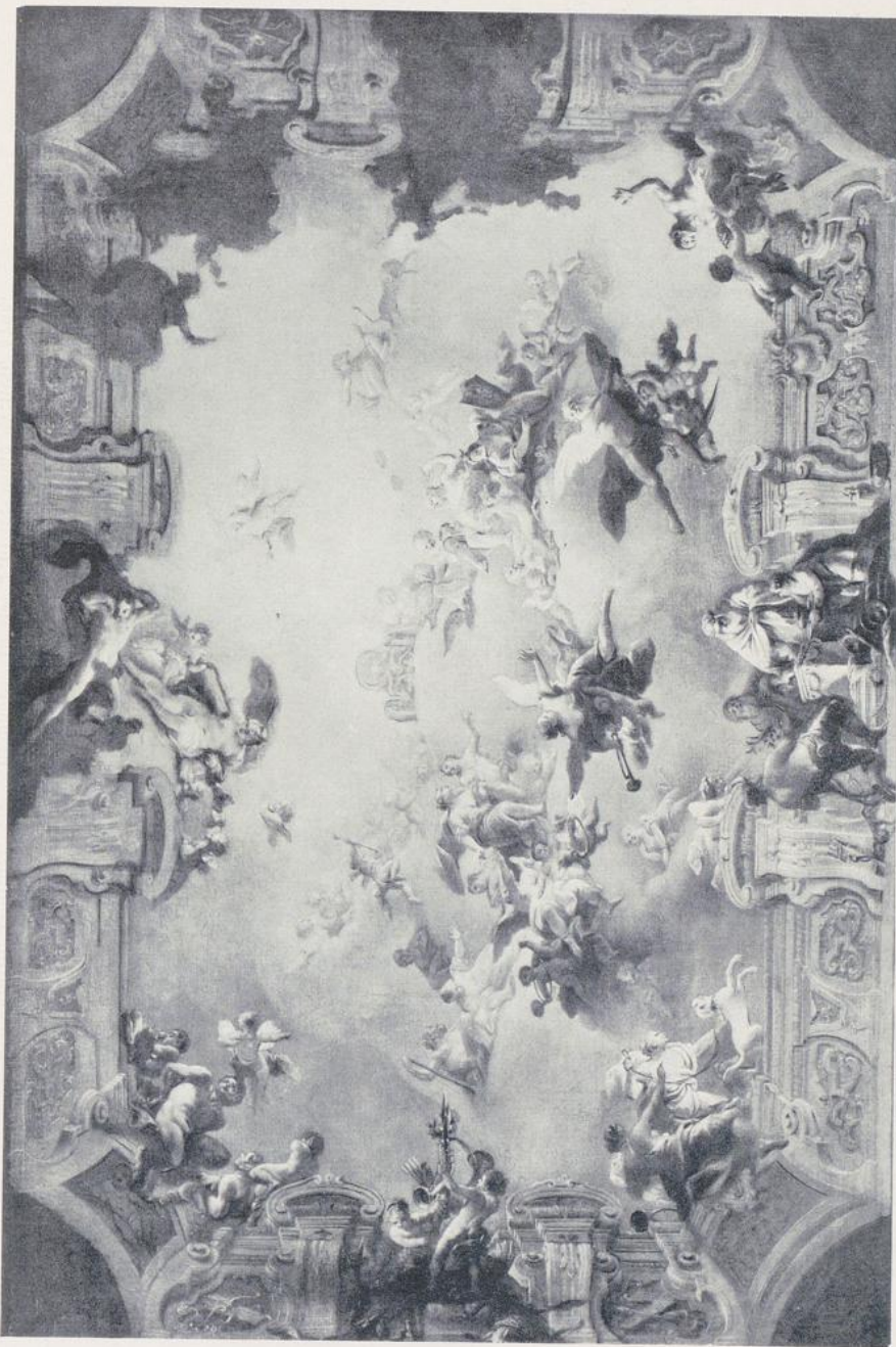
715. Daniel Gran, Deckengemälde im Schloß Eckartsau.