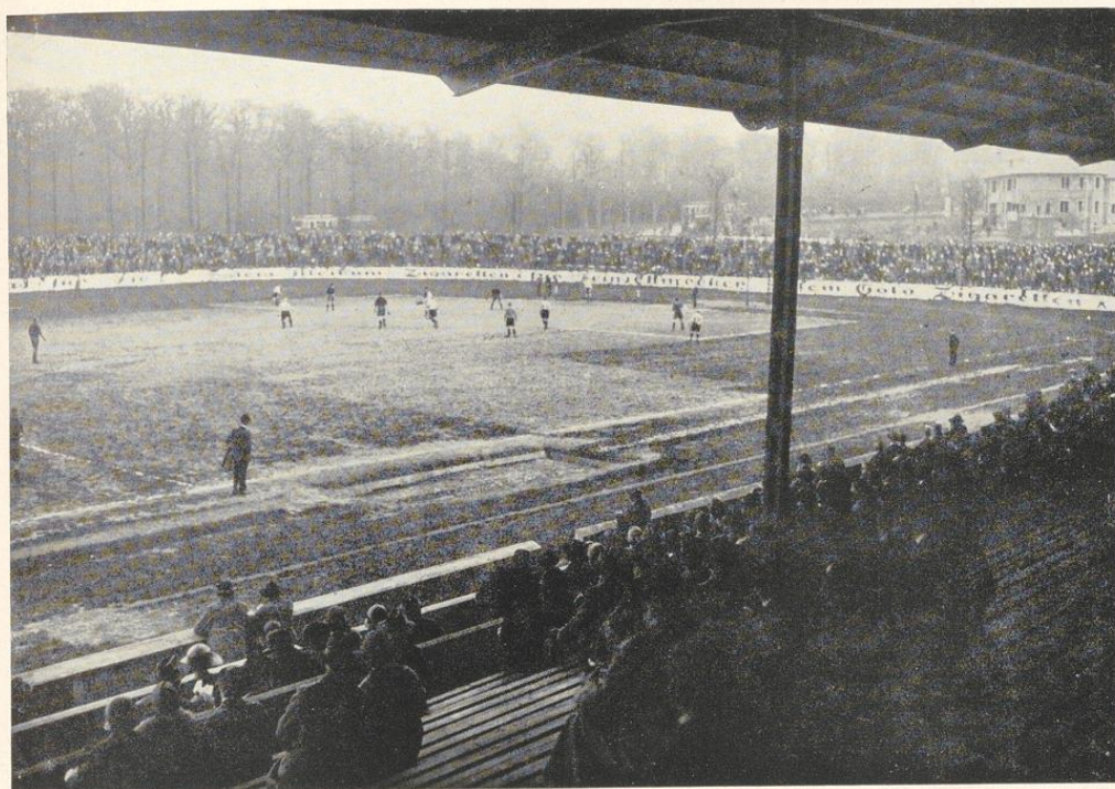
Großsportplatz „Schwarz-Weiß“ am Uhlenkrug

Wassersportplätze am Rhein-Herne-Kanal in Altenessen und Borbeck und das Strandbad in Baldeney, das neben dem Strandbad in Heisingen vielen Tausenden jährlich Erholung bietet. Der Deutsche Jugendherbergsvorband, der Sauerländische Gebirgsverein, der Eifel- und Westerwaldverein, sowie der dem Arbeiter-Sport-Kartell angeschlossene Touristenverein „Naturfreunde“ haben sich die Aufgabe gestellt, ihre Mitglieder mit den Schönheiten der engeren und weiteren Heimat bekannt zu machen. Die Schwerathleten sind in dem Deutschen Athletik-Sportverband von 1891 zusammengeschlossen, die Boxer haben eine Arbeitsgemeinschaft der Essener Amateur-Boxer-Vereinigung gebildet. Neuerdings sind auch Bestrebungen im Gange, die Freunde des Kegelsports in Essen in sportlichem Sinne zusammenzufassen. — Vor dem Kriege war die Herstellung von Spielplätzen mehr oder weniger eigene Angelegenheit der Vereine. Der ehemalige Essener Turnerbund schuf einen Spielplatz aus dem alten Steinbruch an der Kruppstraße. Aus dem Ackerland in Bredeney erstand eine für seine Zeit mustergültige Platzanlage an der Meisenburgstraße. Es folgte der Bau der Platzanlage