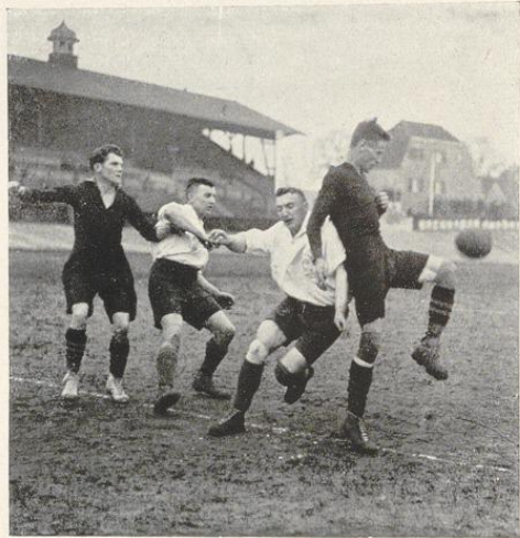
Auf dem Sportplatz (und Radrennbahn) Hubertusburg (Sportverein 99)