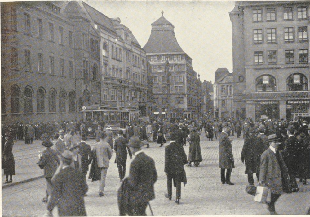
Verkehr am Hauptbahnhofsvorplatz

Der vorläufige Flugplatz liegt an der Grenze des unbesetzten Gebietes, und zwar bei Dorsten, weil infolge der Besetzung des Ruhrgebietes der Flugverkehr in diesem Gebiete noch durch die Entente verboten ist. Der endgültige Flughafen der Luftverkehrsgesellschaft Ruhrgebiet A.-G. wird möglichst im Mittelpunkt dieses Gebietes liegen. Daß der Ruhrbezirk und seine Wirtschaft einen ausgebauten Flugverkehr voll in Anspruch nehmen wird, ist nicht zu bezweifeln. Wenn die Ruhrwirtschaft die von ihr verlangte höhere Produktion erreichen und aufrecht erhalten will, muß sie alle Möglichkeiten einer Verkehrsverbesserung ausnutzen können. Andererseits aber wird die Produktion des Ruhrgebietes mit ihren in alle Weltteile gehenden geschäftlichen Beziehungen eine weit stärkere Benutzung der Handelsluftfahrt ermöglichen, als es die reinen Handelszentren oder schwächer besiedelte Gebiete haben. Die Vorteile der Reisebeschleunigung, also der Einsparung von Zeit zur Erhöhung des wirtschaftlichen Wirkungsgrades sind von besonders großem Wert für alle im Ruhrbezirk ansässigen Industrien.