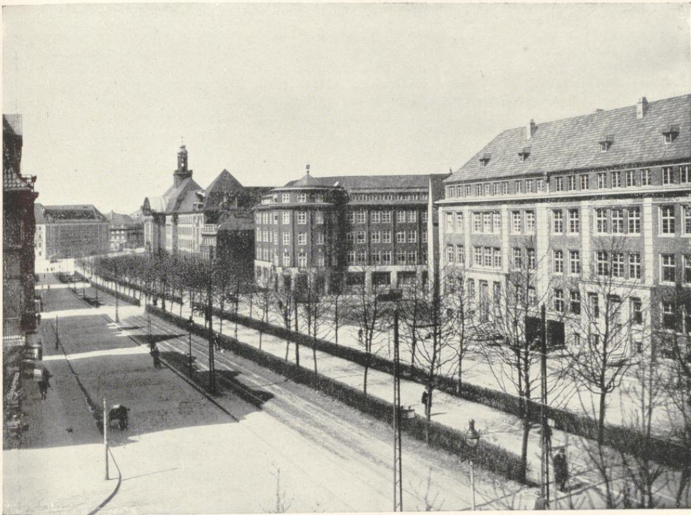
Zweigertstraße (Polizeipräsidium, Justizgebäude, Erzhof)