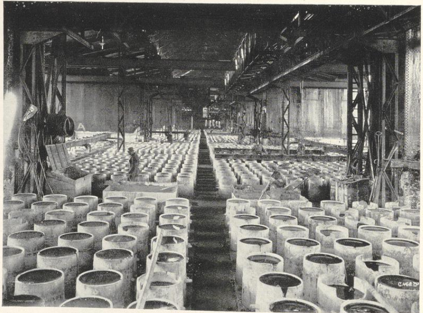
Blockpechgießerei u. Verladehof der Gesellschaft für Teerverwertung m. b. H., Duisburg-Meiderich (größte Teerdestillation der Welt)