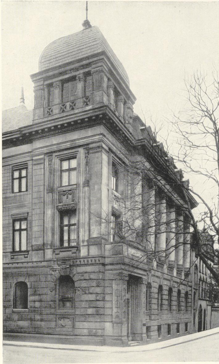
Geschäftshaus der Verkaufsvereinigung für Teererzeugnisse G. m. b. H. in Essen, II. Hagenstraße 45